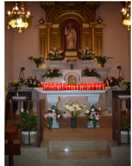
14 d'abril. Monument al Santíssim.