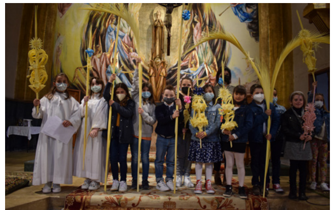
10 d'abril. Diumenge de Rams.