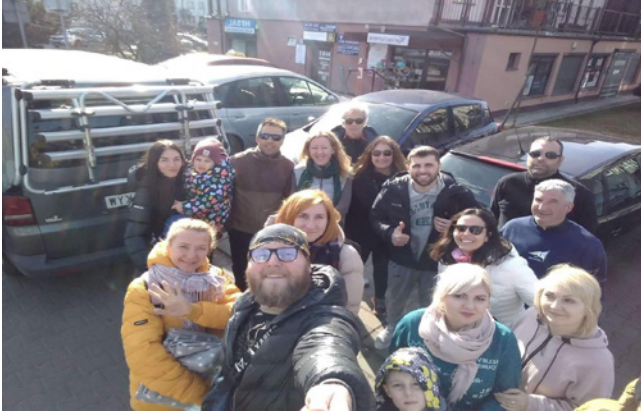
Els expedicionaris amb el grup de refugiats i refugiades.