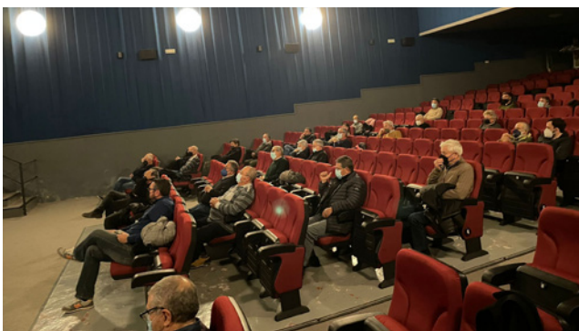
Socis assistents a l'Assemblea

El passat dia 29 de març tingué lloc l'Assemblea General Ordinària de socis de la Cooperativa, que aquest any ja es va poder realitzar de forma presencial, una vegada aixecades diverses restriccions de contenció de la pandèmia de la COVID-19. Es presentaven els comptes anuals