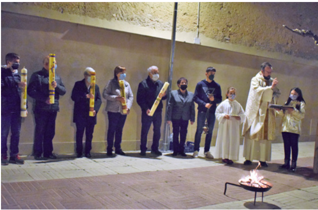
16 d'abril. Celebració del Dissabte de Glòria conjuntament amb altres parròquies del mig Gaià.