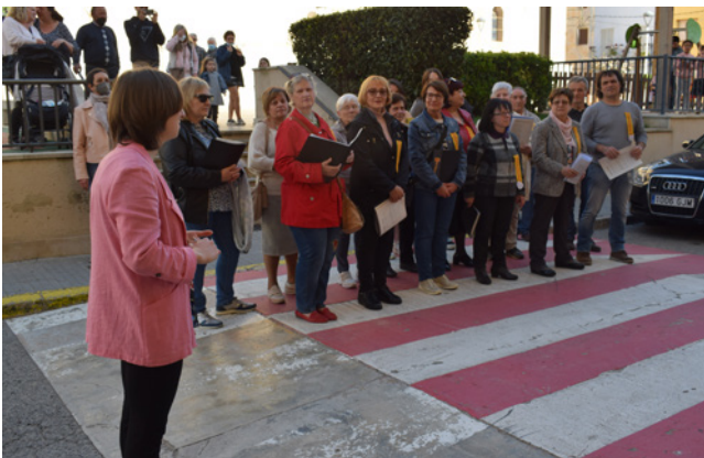
16 i 17 d'abril. Les Caramelles tornen després de la Covid-19.