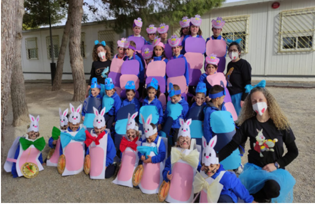
25 de febrer. Carnaval a l'escola.