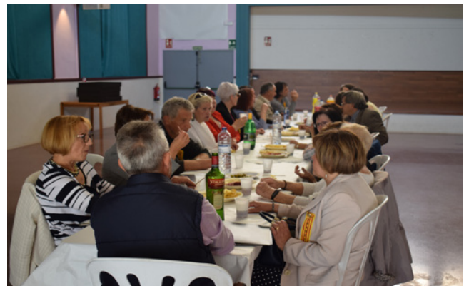
17 d'abril. Els i les cantaires en un petit refrigeri ofert pel Casal, després de cantar per tot el poble.