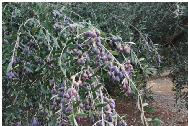
Olivera menya carregada d'olives.