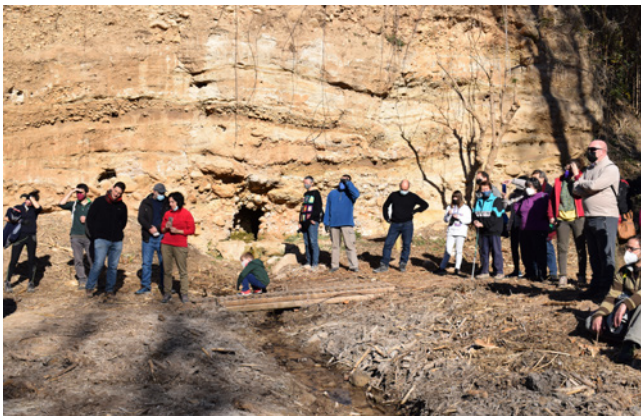
29 de gener. Recuperació de l'espai de la Font Cervellona.