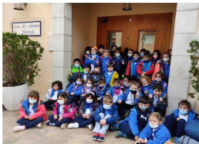
Colònies a Ca Manxol de Rasquera

Durant aquest segon trimestre, a l'escola, hem pogut recuperar diverses activitats que ens fan pensar que un retorn a la normalitat prepanidèmica és possible.