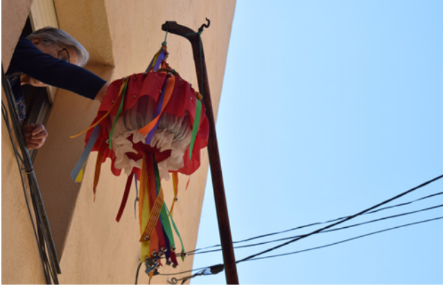
La panera a punt.