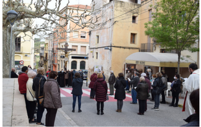
15 d'abril. Divendres Sant, Via Crucis pels carrers de la vila.

estètica amb la presència de la consellera d'Igualtat i Feminismes, Tània Verge. Prèviament, visita de la consellera a l'Ajuntament, al local del Col·lectiu de Dones, a l'escola i xut d'honor al partit de futbol femení entre noies joves i