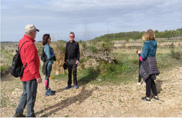
27 de març. Caminada solidària en favor de les persones refugiades d'Ucraïna.