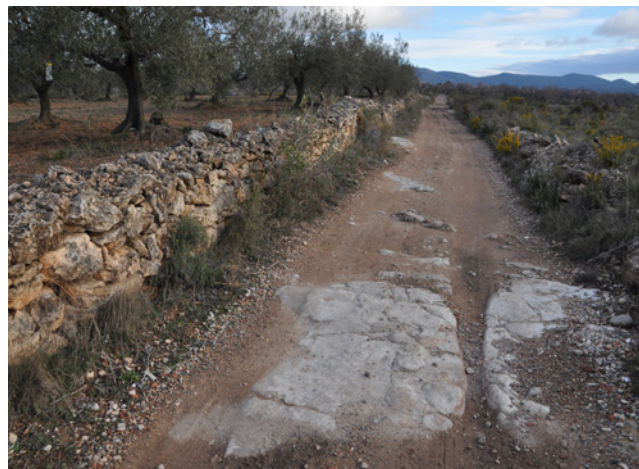
Camí amb marge lateral amb la marca de les roderes del carro estampades al rocalls.

sentit cònic que les protegeix. Algunes oliveres formen fileres situades a les vores d'una parada o d'un camí, destinada a altres conreus. També hi podem trobar camps de la varietat arbequina, que pertanyen a les més recentment plantades. Els cereals, en aquests darrers anys, es tornen a veure vestint la terra de verd en temps primaveral. El blat i l'ordi que del nostre record a l'estiu, nit i dia, alimentava la màquina de batre del «Sindicat». L'ametller és l'altre arbre que podem contemplar amb freqüència. De tant en tant observem petites parades o filades d'ametllers. Alguns desculturats per no dir abandonats. Sabem que durant dècades se'n van arrencar molts i així va anar minvant la magnífica visió que ofereixen durant la florida. Contrasta l'herència dels ametllers vells amb algunes plantacions grans que s'han realitzat en els darrers anys. Recordem molt bé els carrers de la vila plens de canyissos d'ametlles posades a assecar al sol. Menys habitual és veure garrofers. Una mica més cap al sud d'aquesta gran plana de l'Alt Camp hi són més freqüents, alguns d'una volumetria que és d'admirar. Segurament deu existir una frontera invisible definida per les temperatures hivernals. Més al nord de tant en tant el fred els mata i més al sud, amb una mica menys de fred, resisteixen.