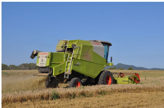
Segant a les Planes.

Les terres agrícolament aprofitades en aquesta part del terme ofereixen una major diversitat de conreus que les de la part de llevant. El característic mosaic mediterrani. La vinya que també hi deu ser prioritària s'entrellaça amb les fermes oliveres de la varietat «menya», algunes de les quals tenen un volum de capçada considerable, tot i que la gelada de l'any 1956 les va matar. Els dos o tres llucs que es deixaren de la brosta posterior són ara uns troncs vigorosos que en segons quins llocs deixen veure la soca o algun del troncs serrats després de la gelada. En altres camps al voltant de les oliveres s'hi ha fet un amuntegament de terra en