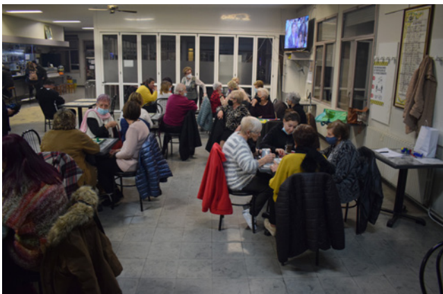
25 de febrer. Campionat de parxis.