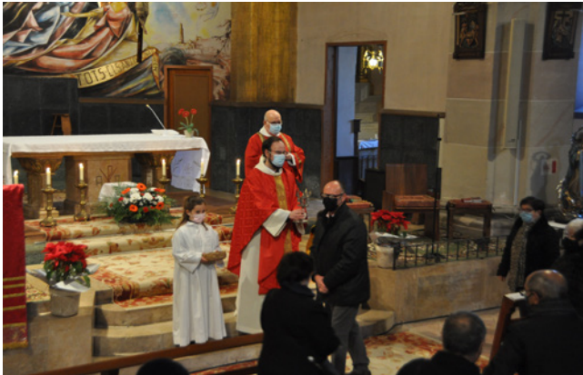
20 de gener. Missa de Sant Sebastià.