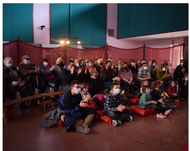
10 d'abril. "Kumuluninbu" espectacle de titelles.