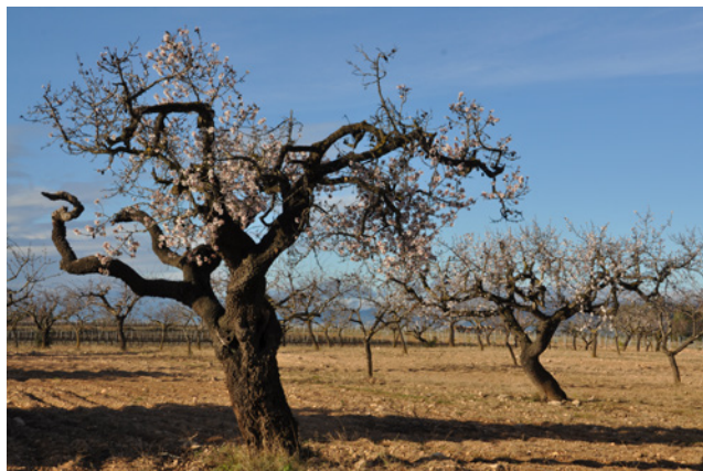
Parada d'ametllers vells florits.

implementació dels tractors, quan la jornada al tros era de sol a sol, esmorzar i dinar inclosos. Edificacions que bellament humanitzen les terres agràries de les nostres comarques. Lloc de refugi i sopluiig, per guardar-hi eines, estris de tota mena, trills, palla o per tancar-hi l'animal, les més grans. Unes necessitats que han desaparegut del tot i que en no ser-hi la seva conservació està amenaçada, llevat que existeixi un interès particular del propietari. El vandalisme i el robatori de ferralla sovint les ha deixades amb les portes esbatanades sense que posteriorment s'hagi mostrat interès en la seva reparació.