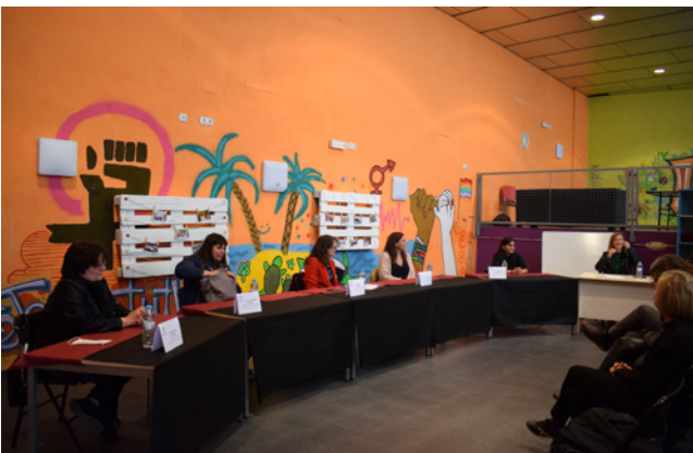
9 d'abril. Tània Verge, Consellera d'Igualtat i Feminismes, participant a la taula rodona sobre "La pressió estètica a debat" al Lokal Jove.