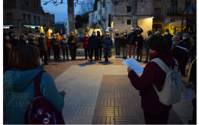
1 de març. Acte de rebuig a la guerra d'Ucraïna.

* Jornada de Portes obertes a l'escola Bernardí Tolrà.