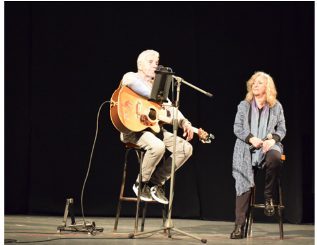
13 de març. Xerrada i mini concert del Dr. Estivill

clixés de gènere i treu a escena els grans temes femenins dels que ningú parla. A l'escenari tres joves actrius amb molta energia i amb una química escènica innegable, parteixen des dels seus propis cossos i la seva pròpia realitat per