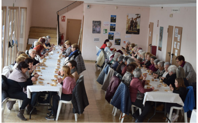
24 de febrer. Berenar de Dijous Gras.