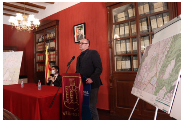
31 de març. El vicepresident Puigneró presenta el Pla Director Urbanístic d'activitat econòmica de la Plana de l'Alt Camp

La tercera actuació era l'acceptació del projecte de construcció de la nova EDAR i l'inici dels tràmits de la seva construcció, estimats en divuit mesos. Malauradament, l'Agència Catalana de l'Aigua encara no ha acceptat el projecte per l'existència de diverses discrepàncies. Durant aquests mesos, voldríem destacar la visita de diverses persones de la Fundació Mestral, les quals van avaluar l'accessibilitat de la via pública i dels equipaments municipals per a persones amb dificultats de mobilitat. El resultat fou l'alerta sobre la necessitat de dur a terme diverses actuacions en aquest àmbit com serien el de garantir l'absència d'automòbils a la vorera, o alguns accessos a equipaments municipals. En l'àmbit de la igualtat, es vol destacar les activitats impulsades des de l'Ajuntament durant el dia de la dona (8 de març). Es va realitzar una lectura de contes a la biblioteca, la lectura del manifest, diversos espectacles de carrer, diferents tallers, l'exposició "Lliures i sense