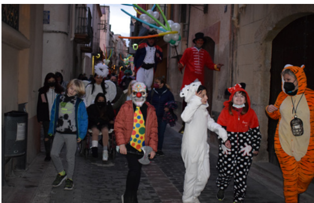
19 de febrer. Carnaval.