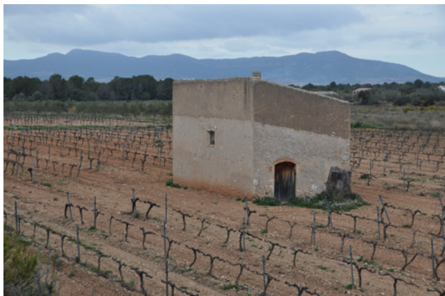
Pallissa envoltada de vinya.