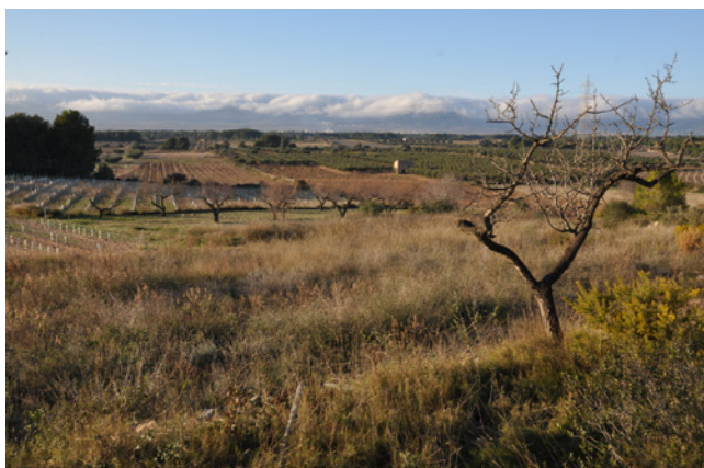
Les Planes, mirant cap al Pla i Figuerola en un dia de «peluda».

ser altre que apilar al límit de la parada les pedres que va caldre treure del subsòl per fer conreable la terra, quan fou artigada. Són els marges de dues cares, a vegades d'una amplada i una alçada que impressiona. Pedres, així mateix, que s'utilitzaren per construir les barraques de pedra seca que de fa temps tant d'interès patrimonial desperten. Pedres, tantes, que ja no en devien saber què fer en despedregar la terra verge, apilades en alguns clapers que trobem al mig o al marge d'una parada. De marges n'hi ha de diverses formes constructives. Alguns amb les pedres apilades en sentit horitzontal fins arribar a l'alçada que va convenir. En altres l'horitzontalitat del marge fou culminada amb una filera de pedres posades de cantell en sentit vertical. Hi ha alguns marges fets de dalt a baix amb les pedres col·locades en sentit vertical i fins i tot alguns de forma inclinada. Marges amples de doble cara amb les pedres més grosses muntant la paret externa i el pedruscall a la part interior. Unes i altres formes d'apilonar ordenadament les pedres deu correspondre a la tècnica dels margeners que els construïren. També pedres per edificar les nombroses pallisses escampades entre els trossos de terra que tanta utilitat van tenir en èpoques precedents a la