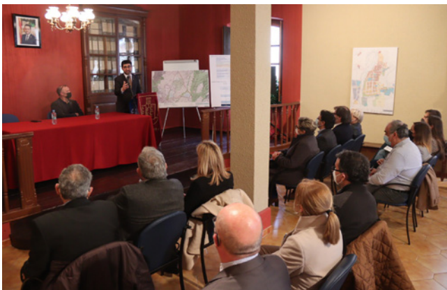
31 de març. Visita del vicepresident Puigneró per presentar el Pla Director Urbanístic d'activitat econòmica de la Plana de l'Alt Camp.

per portar material sanitari per a les víctimes de la guerra de Ucraïna i recollir 10 persones refugiades i portar-les fins a Reus on varen ser acollits per diferents famílies, en col·laboració amb l'Associació