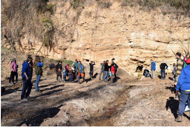
29 de gener. Recuperació de l'espai de la Font Cervellona