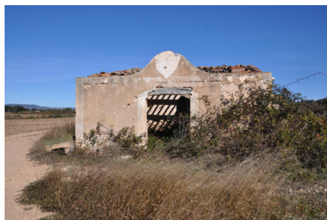
Pallissa totalment ruïnosa amb rellotge de sol a la façana.