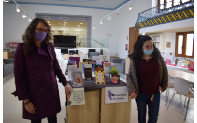
9 d'abril. La Consellera d'Igualtat i Feminismes visitant la biblioteca.

* Visita del conseller i vicepresident Puigneró per presentar el pla