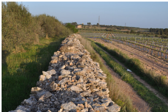
Ample marge de dues cares.

moment donat posseïa aquella porció de terra. La delimitació del terme envers els altres tres esmentats no deu estar pas configurat per elements orogràfics identificables que els separin, que siguin els que en concretin les afrontacions. La continuïtat orogràfica i paisatgística entre els termes veïns s'estén al llarg d'aquesta gran plana. De la mateixa manera, per posar un exemple, existeixen les Planes de Santes Creus, limitant pel nord amb les vila-rodonines.