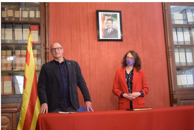
9 d’abril. Visita de la Consellera d’Igualtat i Feminismes Tània Verge

del Guardià, situat a l’oest dels polígons industrials de Planes de la Serra i de Bràfim/Alió. En el cas del nostre municipi, la proposta reordena el polígon existent i s’adequa a les demandes del mercat de naus de grans dimensions per a activitats industrials i logístiques. Acompanyant a aquestes actuacions es volen impulsar mesures de preservació de la zona agrícola i de reordenació del territori. Coincidint amb la presentació d’aquest PDU, s’inicia un procés de participació amb el que pretenem involucrar a les entitats, les veïnes i els veïns, a l’hora de configurar el projecte final. Properament, s’anunciarà la sessió que es realitzarà a Vila-rodona. També volem destacar el llançament d’una nova APP (eAgora) que busca integrar diversos serveis que s’estan realitzant amb diverses aplicacions, millorar la comunicació amb les veïnes i veïns, facilitar la realització de processos participatius i facilitar que les