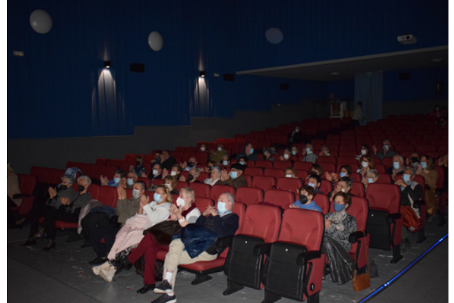
13 de febrer. Concert de "Donesstrings"

En l'edició de Sant Jordi de la revista Caliu, expliquem les activitats que s'han portat a terme des de Nadal fins a Setmana Santa, i tot i que encara hem tingut algunes restriccions per l'enèsima onada de la Covid-19, hem continuat amb la sessió de cinema el diumenge a la tarda, amb una assistència d'entre 30 i 50 persones.