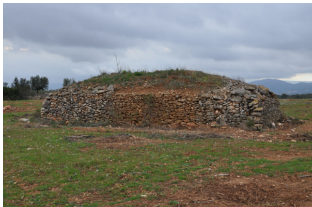
Claper. Apilament de pedres.