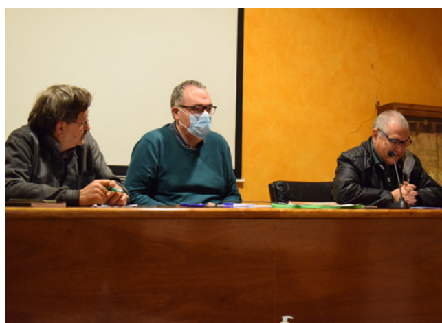
26 de març. Assemblea anual.