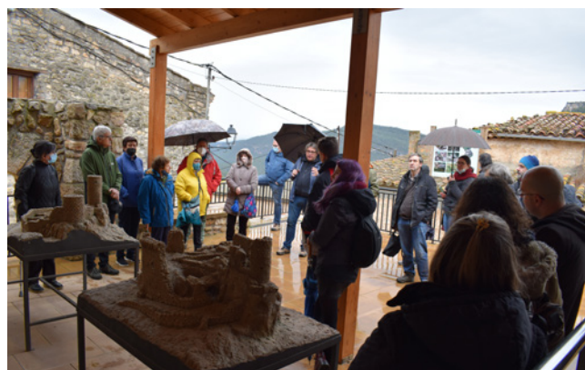
26 de març. Visita al Castell de Querol.