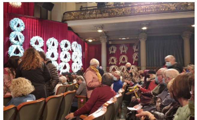
19 de març. Sortida al teatre.