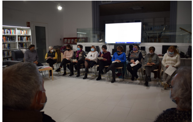
24 de març. Celebració del dia mundial de la poesia.