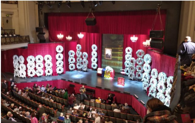
19 de març. Sortida al teatre.