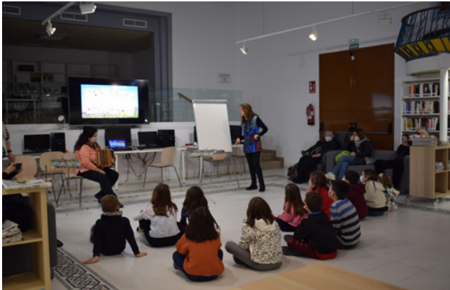
18 de març. Presentació del llibre "Endevinalles Musicals".