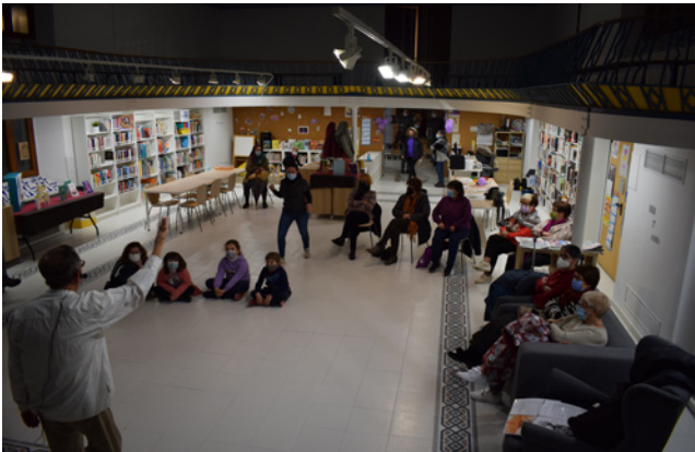
8 de març. Conta contes i lectura del manifest.

* Concentració a la plaça dels Arbres per manifestar el rebuig al conflicte bèl·lic entre Rússia i Ucraïna.