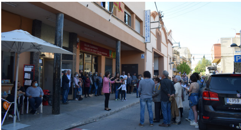
16 d'abril. Cantada de caramelles davant del Casal i la Cooperativa

de diferents canals: la pàgina web www.casaldelavila.cat , a les xarxes socials d'Instagram i Facebook. I a la plataforma de eBando, i que podeu descarregar-vos l'aplicació i seguir el canal del Casal de Vila-rodona o bé llegir-nos des de qualsevol dispositiu seguint l'enllaç: https://app.ebando.es/channel/casaldevilarodona .