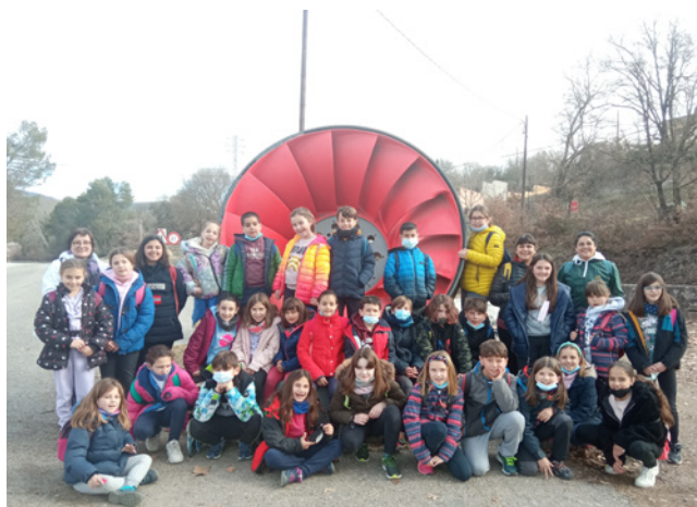
Colònies a l'Entorn d'Aprenentatge de Tremp