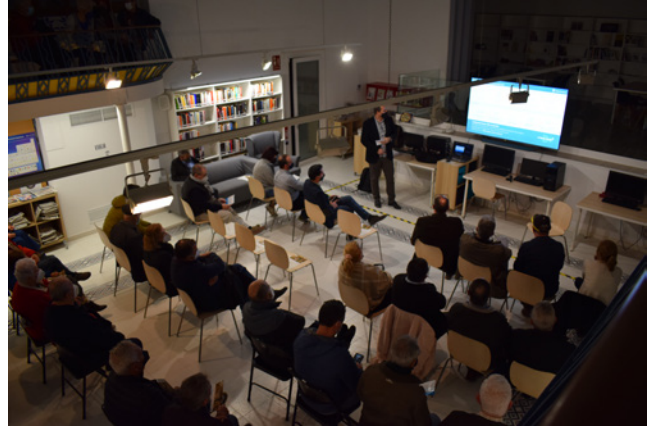
24 de febrer. Presentació del projecte d'entrada al poble

por” a la biblioteca i la projecció de la pel·lícula “Frida”, al Casal de Vila-rodona. Fruit de les polítiques actives portades a cap en aquest àmbit, el passat 9 d’abril ens va visitar la Tània Verge, Consellera d’Igualtat i Feminismes on, entre altres activitats, va participar en una taula rodona sobre “La pressió estètica a debat” al Lokal Jove. En l’àmbit de Medi Ambient, el passat 29 de gener es va dur a terme un acte de recuperació de l’albereda de la font Cervellona, projecte impulsat per l’organització mediambiental “La Sínia”, el CEG i Terres del Gaià, i que compta amb la col·laboració de l’Ajuntament de Vila-rodona, de l’Ajuntament d’Aiguamúrcia i de l’ACA. De fet, encara continuen els treballs per adequar un dels meandres que el riu ha abandonat, per intentar esmorteir la força de les gaianades. Combinat amb l’àmbit del turisme, s’han iniciat les caminades de descoberta de l’entorn del municipi. Després de la suspensió de la Festa Major