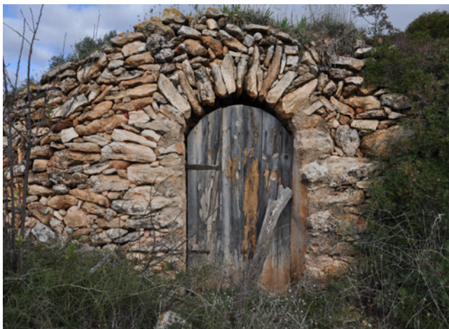
Barraca de pedra seca.