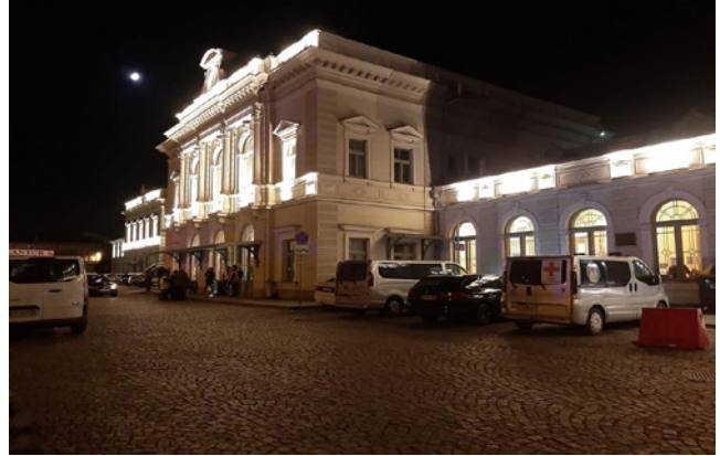
Estació de tren de Przemysl (Polònia), lloc de trobada.