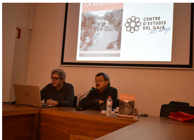
11 de març. Presentació de "La Resclosa" a Rodonyà.