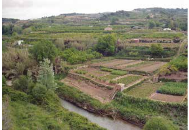
Horta de la Racó. 1991