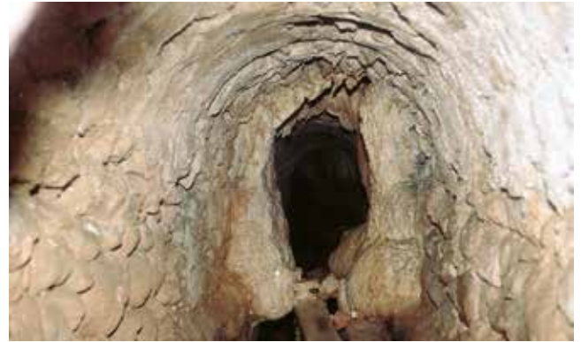
Interior de la mina de la Trona. 1991

No tenim constància documental de si aquests trams de mines van ser realitzats o no, l'obra a fer no era pas menor: uns 900 metres de mina, 367 dels quals es considerava que s'havien de fer amb revoltó. El que sí que quedava clar en aquest document és que l'objectiu era fer tornar l'aigua a Vila-rodon, cosa que en aquells moments no devia succeir. L'import de l'obra també