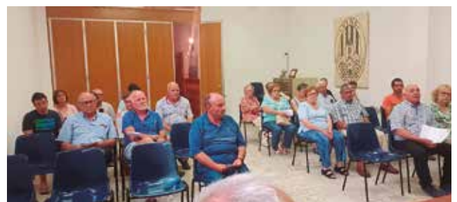
30 de juny, Assemblea General d'Agrícola de Bràfim