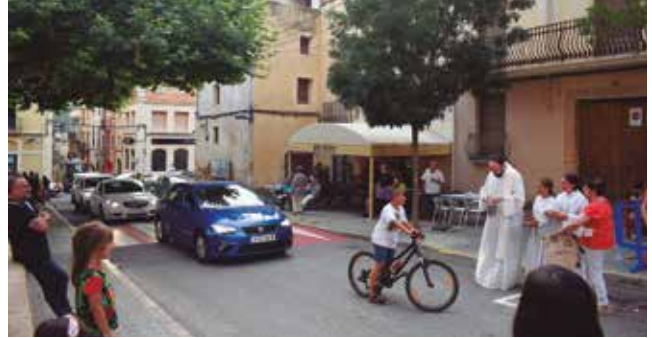
15 de juliol, benedicció de Sant Cristòfol