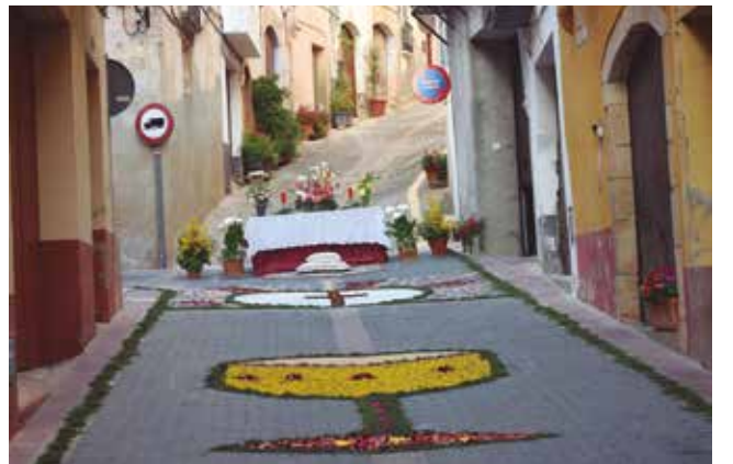
10 de juny, processó del Corpus