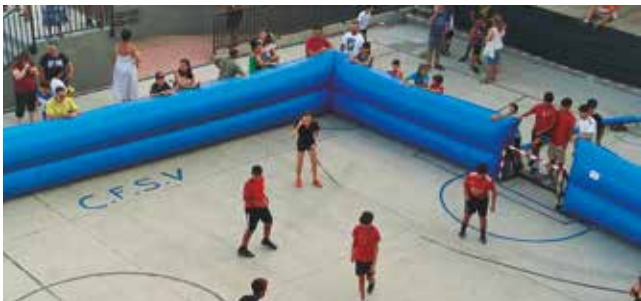
24-29 de juliol, 3x3 de futbol