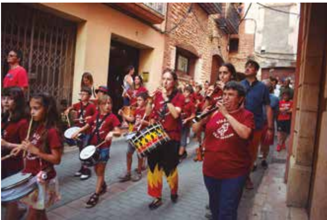
23 de juny, arribada de la flama del Canigó