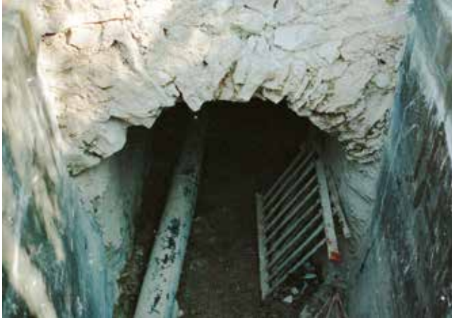
Sortida de la mina de la Trona. 1991