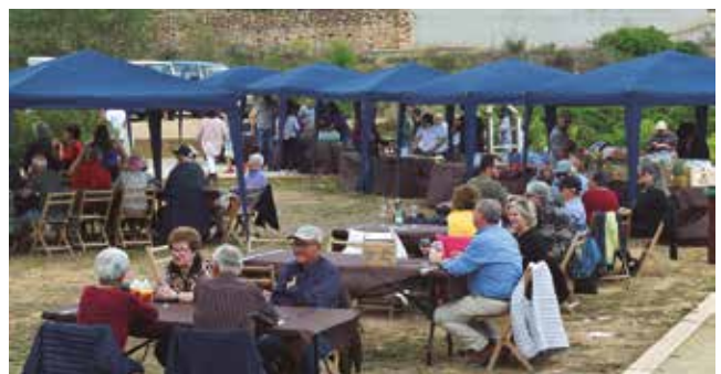
21 de maig, Columbarium tapa