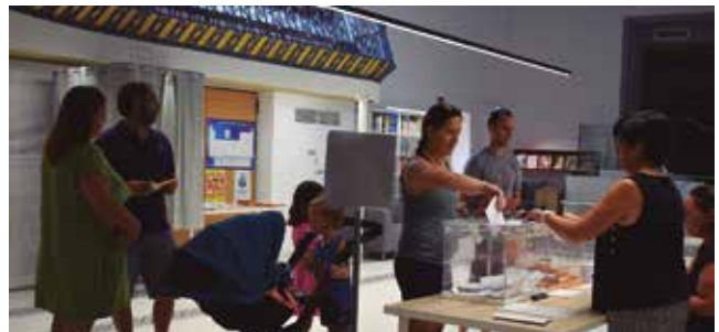
23 de juliol, eleccions generals a corts