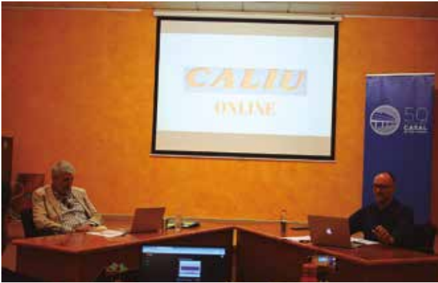
23 de maig, debat entre els candidats a les eleccions municipals