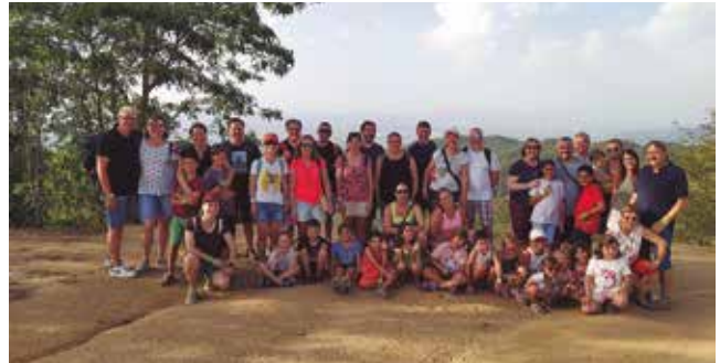
9 de juliol, excursió de caramelles del grup infantil