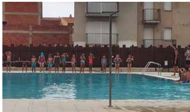
2 de juliol, final dels curssets de natació