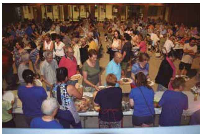
8 de juliol, sardinada