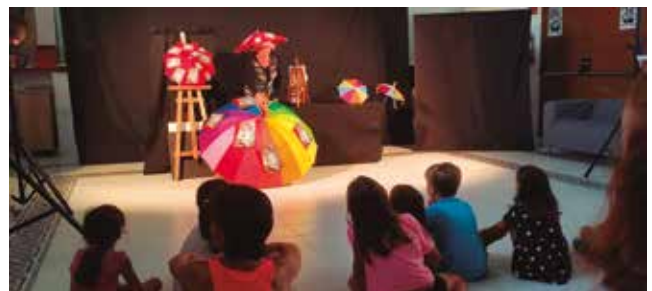
28 de juliol, teatre de titelles