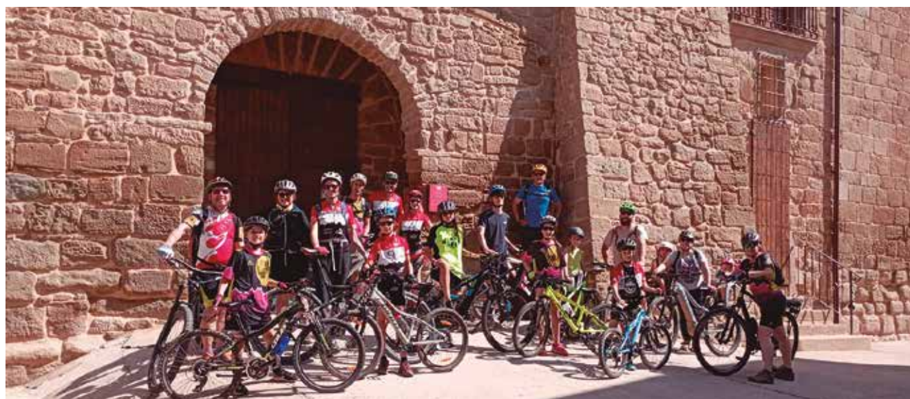
4 de juny, castells de la Segarra

es va fer per una ruta circular fins a Les Pallargues on a les 13h estava programada una interessant visita a l'interior del castell, que encara segueix habitat. En acabar, es va di-