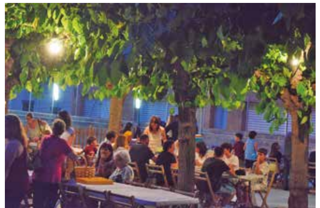
23 de juny, sopar de revetlla a les Moreres