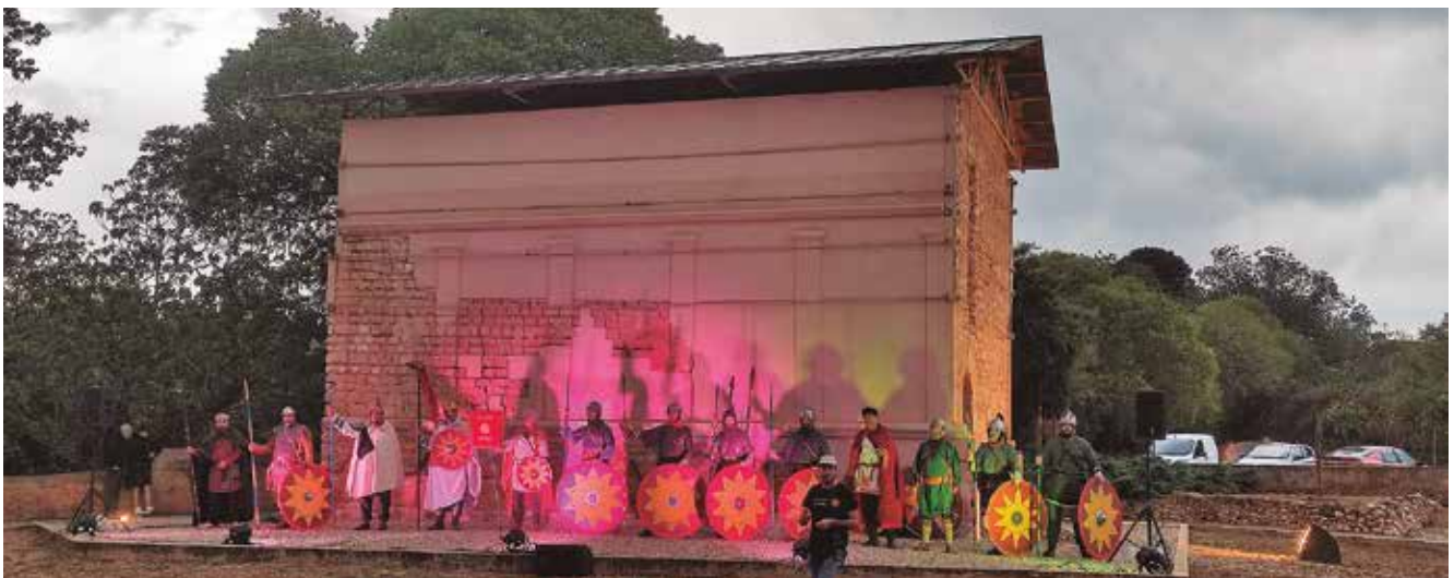
13 de maig, representació de Tarraco Viva