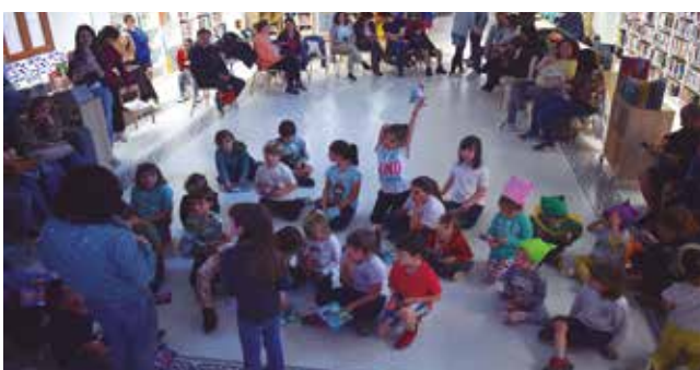
19 de maig, supèrnit a les biblioteques.