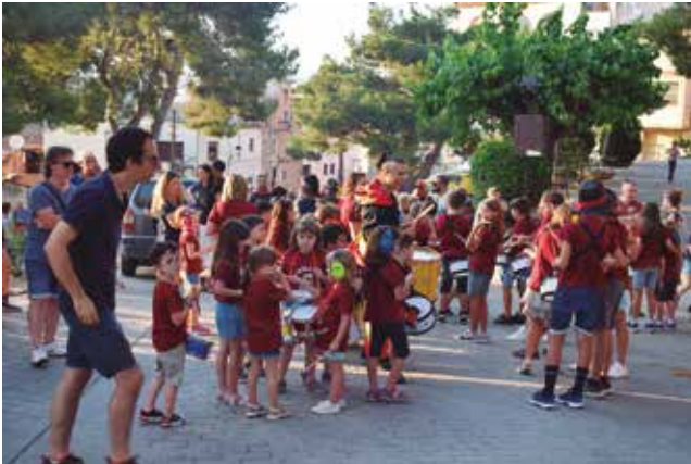
23 de juny, arribada de la flama del Canigó