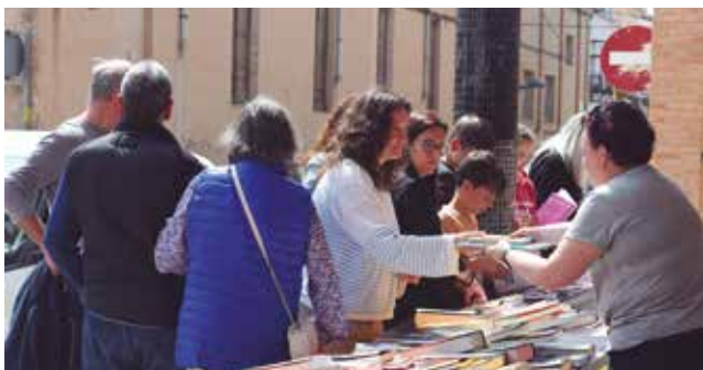
23 d'abril, parada de llibres