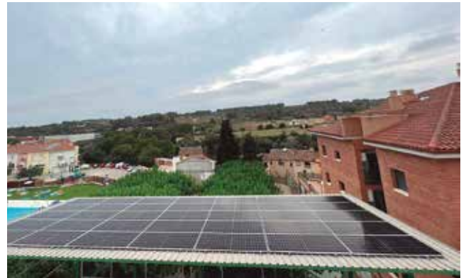
Instal·lació d'energia fotovoltaica