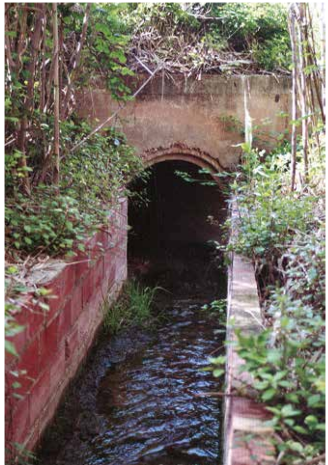
Sèquia encara per entubar. 1991

Un altre període del que en tenim notícies documentals continuades és de principis del segle XIX quan es va construir la mina de la Trona. El metge Francesc Guasch l'any 1807 va escriure i publicar un tractat sobre una epidèmia que va afectar Vila-rodonà els anys 1804 i 1805. Entre les seves causes apuntava la interrupció de l'arribada de l'aigua de la sèquia. Durant dos mesos de la primavera de 1804 no va baixar aigua. Explicava que com que la sèquia passa per sota les cases del poble es va produir una mena de podriment de restes vegetals, el mateix llim de la sèquia i insectes. Tot plegat causava una pudor intensa que sortia de les boques de la mina que se sentia del carrer estant. Els pous del poble gairebé van quedar esgotats, cosa que confirma, com hem dit, la utilitat per a usos domèstics de l'aigua de la sèquia, més enllà dels usos per moldre i regar. Guasch apuntava el fet