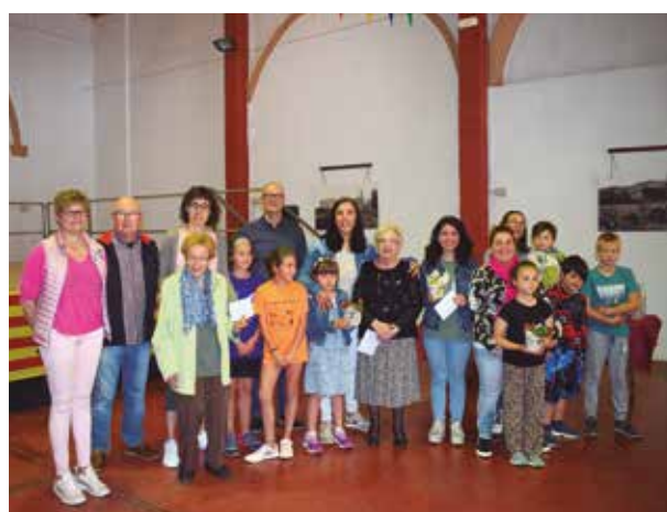
Concurs "adorna el teu balcó"