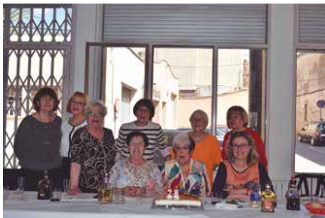
25 d'abril, dinar de celebració del 28è aniversari