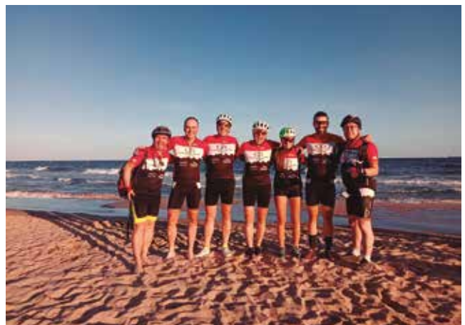
1 de juliol, sortida d'estiu a la platja

El dia 29 de juliol el Club BTT Vila-rodonà va col·laborar amb el I memorial BTT Rubén Berruezo Calaf. Es va fer una sortida semi-nocturna des de Rodonyà, passant per les Pinetelles, arribant a Vila-rodonà on hi havia un avituallament i la tornada va ser per Vilardida acabant a Rodonyà. Va ser una ruta pensada per poder fer-la tothom amb només 17 quilometres i poc desnivell, on es va voler tenir un record per al nostre company que tant li agradava anar amb bici.