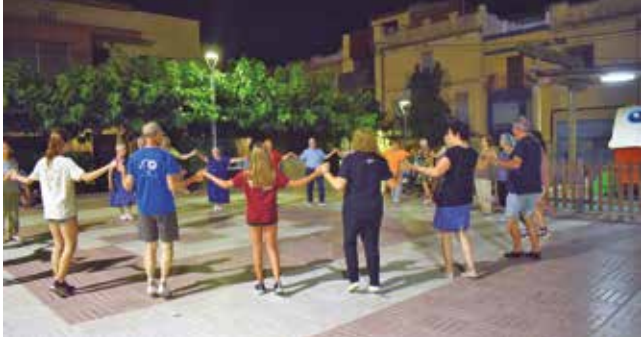
Curset de sardanes