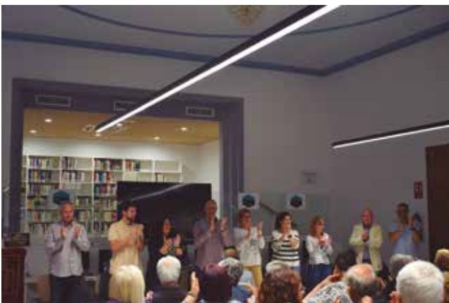
26 de maig, acte final de la candidatura "Som-hi Vila-rodonà" a la biblioteca.