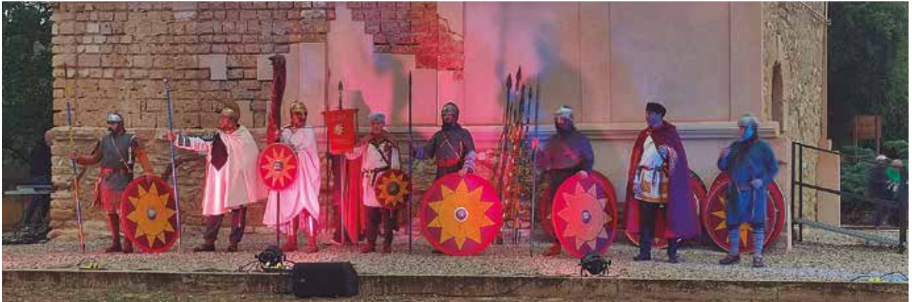
13 de maig, representació de Tarraco Viva