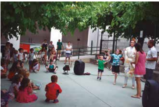
29 de juny, contes per la igualtat