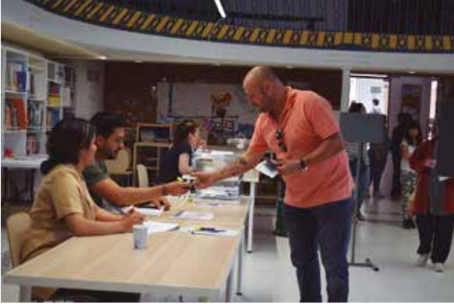
28 de maig, eleccions municipals.