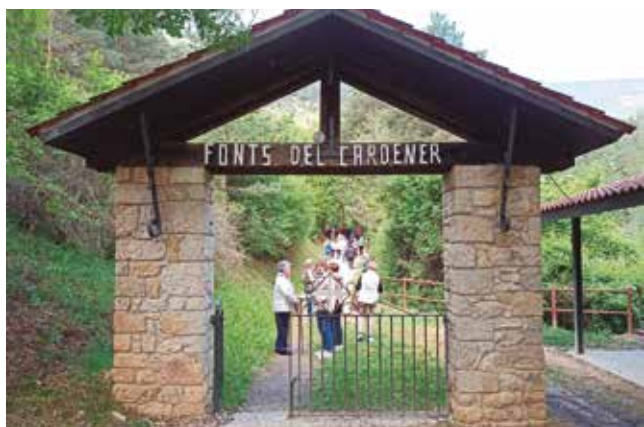
20 maig, a les Fonts del Cardener i Sant Llorenç de Morunys