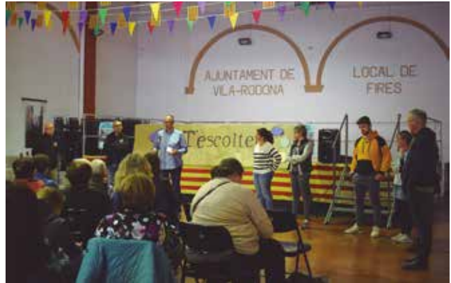
19 de maig, acte electoral de "Som-hi Vila-rodona"

tres i 7 alumnes de cicle superior de l'escola Bernardí Tolrà.