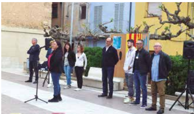
22 d'abril, Presentació de la candidatura "Som-hi Vila-rodonà"

* Presentació de la candidatura municipal "Junts fem futur. Compromís per Vila-rodonà".