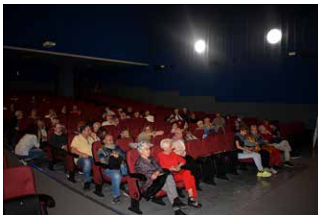
30 d'abril, teatre “Un concert a la Casa Blanca”

En l'edició de la Festa Major d'estiu de la revista Caliu expliquem les activitats que s'han portat a terme des de Sant Jordi fins a finals de juliol. Hem continuat amb la sessió de cinema el diumenge a la tarda, amb una assis-