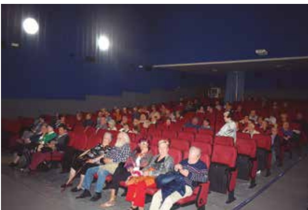
1 de maig, Festa de la Gent Gran, espectacle de l'esbart dansaire d'Arenys de Munt