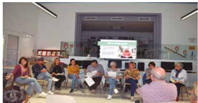
28 d'abril, tertúlia a la biblioteca sobre el llibre de Josep M. Espinàs "A peu per l'Alt Camp"