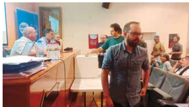
30 de juny, Assemblea General del Celler Cooperatiu de Vila-rodona

El divendres dia 30 de juny de 2023 van tenir lloc les Assemblees Generals Extraordinàries de les cooperatives de CELLER COOPERATIU I SECCIÓ DE CRÈDIT DE VILA-RODONA, SCCL i AGRÍCOLA I SECCIÓ DE CRÈDIT DE BRÀFIM, SCCL,