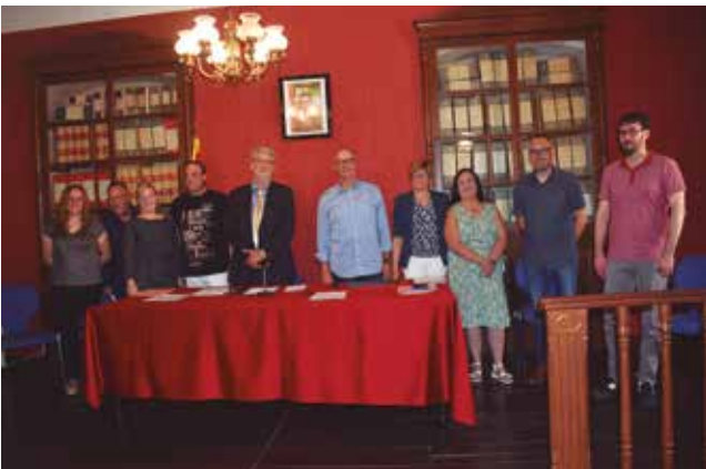
17 de juny, nou Consistori municipal