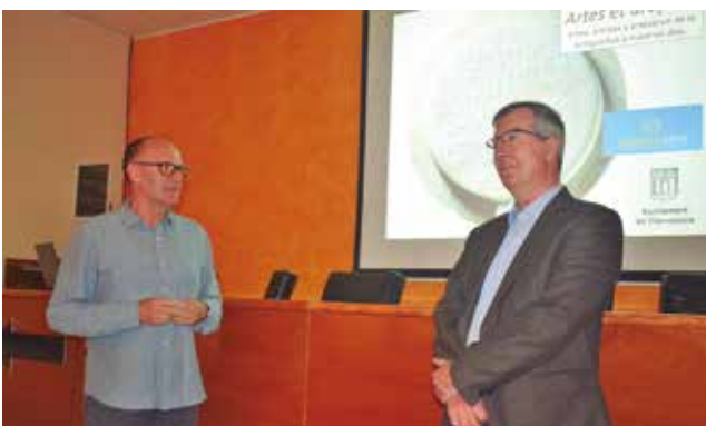
10 de maig, conferència "Artis et artífices"

* Última mobilitat del projecte Erasmus+ "Hello Dear Cli-mates" a Timisoara (Romania) per part de dues mes-