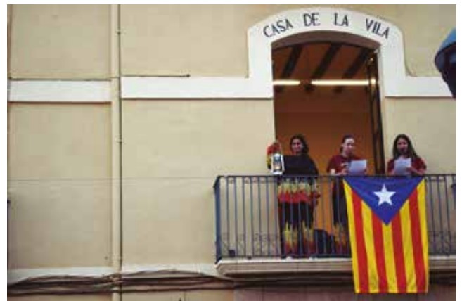
23 de juny, lectura del manifest