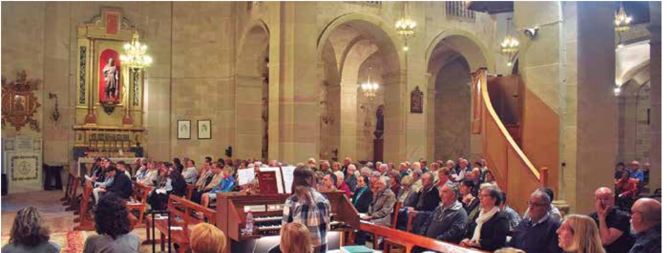
27 de maig, Vetlla de Pentecosta