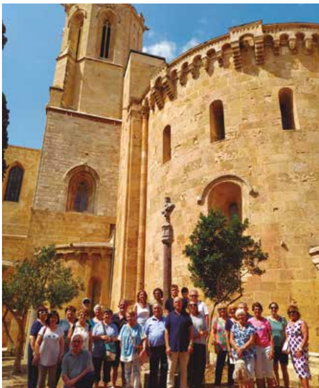
22 de juliol, excursió del grup de caramelles d'adults