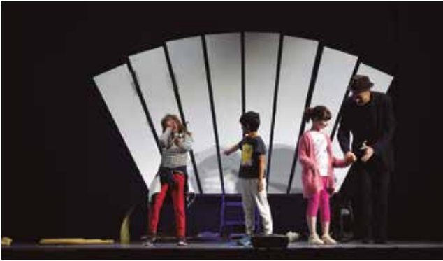
14 de maig, espectacle familiar "La Màquina del So"