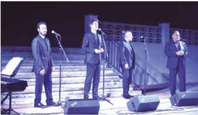
1 de juliol, concert de gospel i soul amb "The Gournets Vocal Concert"