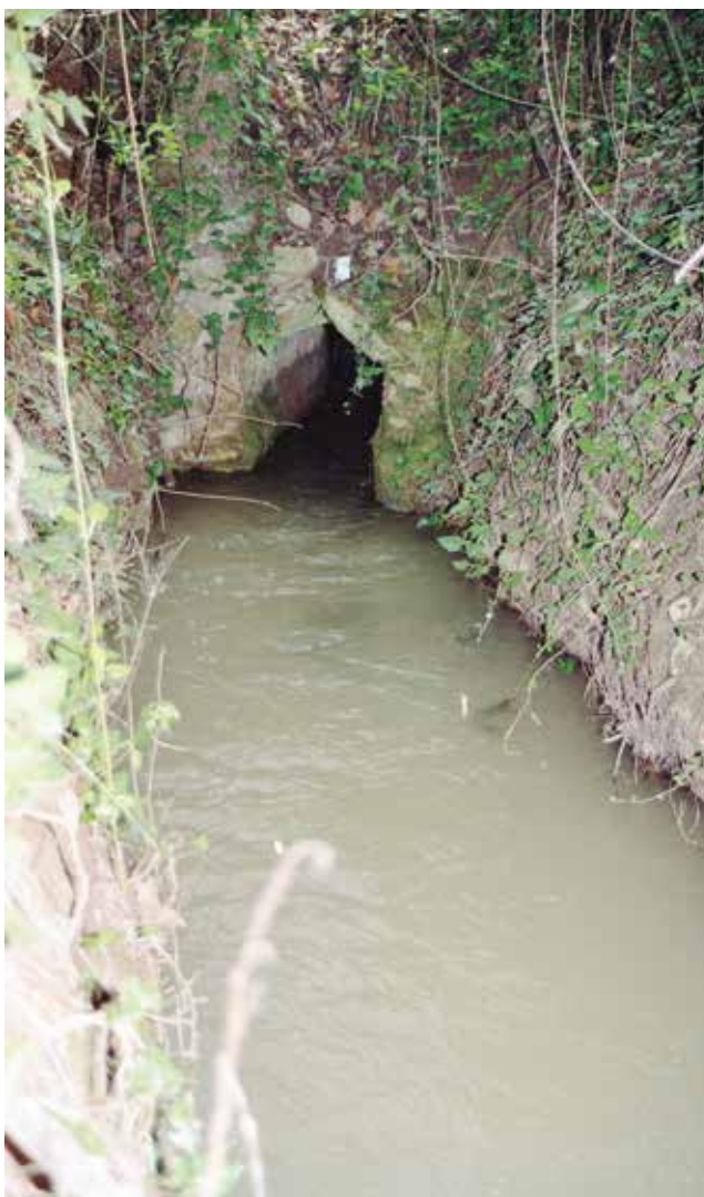
Entrada de la primera mina després de la resclosa de Santes Creus. 1991

Les obres de conducció d'aigua potable des de la font dels Rajolins situada al torrent de Rubió, al terme d'Aiguamúrcia, va finalitzar l'any 1893, ara fa 130 anys. Fins aleshores, l'aigua de consum de boca i d'altres usos domèstics devia procedir d'alguns pous, d'alguna font i para de comptar. Tenint present que la sèquia travessa pel mig del poble, no és pas difícil pensar que l'aigua que porta, a part de fer rodar la mola volandera del molí fariner i de regar les hortes, devia servir per a molts altres usos, per exemple per al bestiar que hi havia a totes les cases o corrals. Les persones més grans recordaran l'abeurador que hi havia a la plaça, tocant a cal Ferrer on bevien les mules quan anaven o venien del defora. L'aigua provenia de la sèquia.