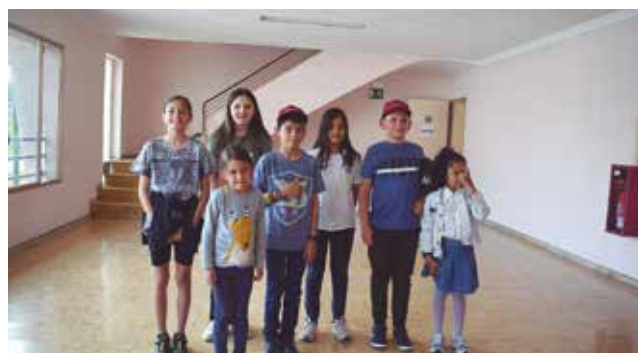
11 de maig, lliurament de premis del certamen literari "Caliu"