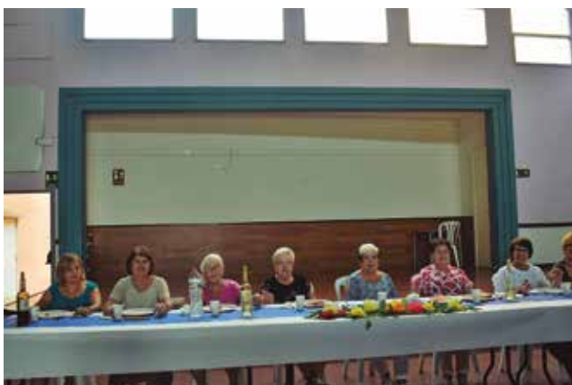
21 de juny, berenar de fi de curs

El dia 25 d'abril vàrem celebrar el 28è aniversari del Col·lectiu al Casal de Vila-rodona, amb dinar i Ringo, amb un gran èxit de participació.