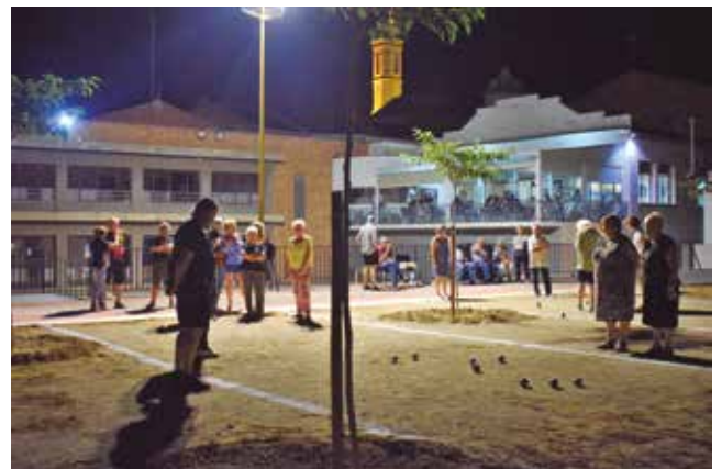
7 de juliol, inici del campionat de petanca