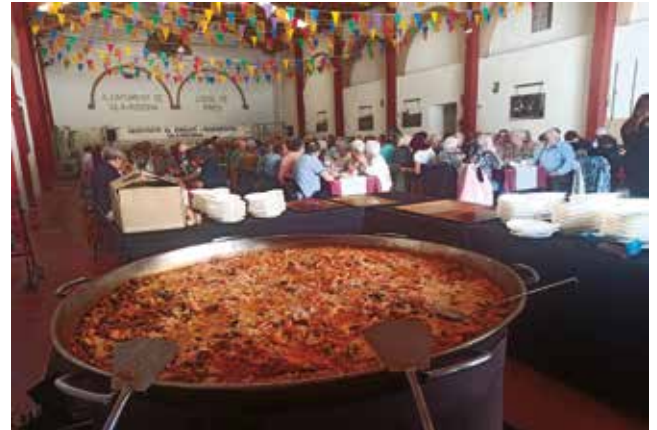
1 de maig, Festa de la Gent Gran, dinar d'aniversari de l'Assoc. de Jubilats.