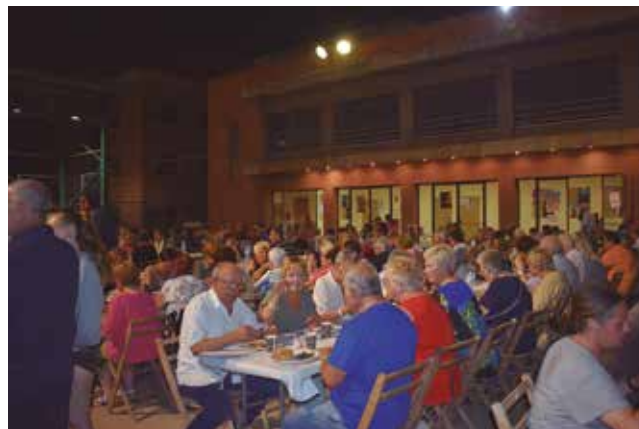
8 de juliol, sardinada