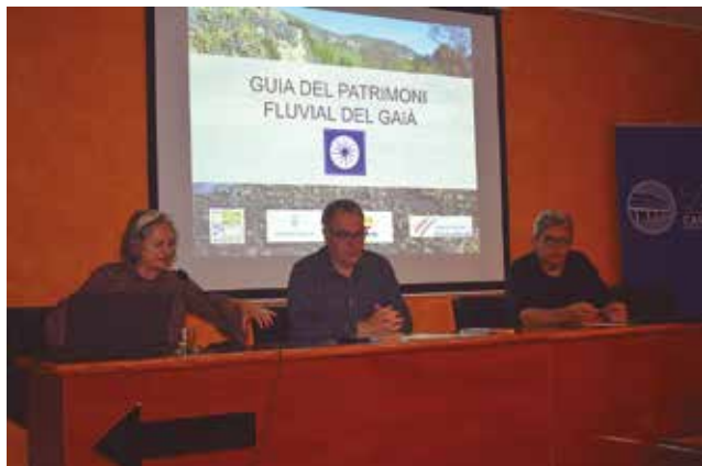
6 de maig, presentació de la guia "El Gaià, recorregut i patrimoni"