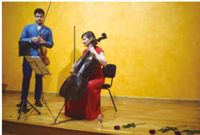
23 d'abril, concert homenatge a Pau Casals