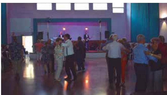
1 de maig, Festa de la Gent Gran, ball