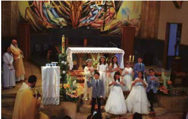
14 de maig, Primera comunió