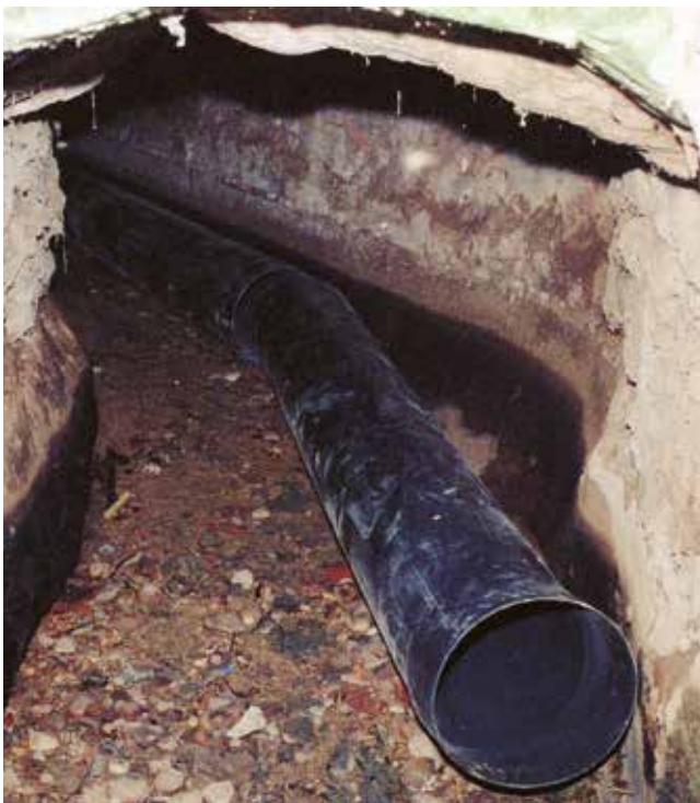
Pas per sota les cases del poble en el moment d'entubar la sèquia. 1991