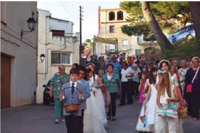
10 de juny, processó del Corpus