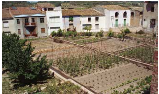
Horts del poble. 1991

Un altre període del que en tenim notícies documentals continuades és de principis del segle XIX quan es va construir la mina de la Trona. El metge Francesc Guasch l'any 1807 va escriure i publicar un tractat sobre una epidèmia que va afectar Vila-rodonà els anys 1804 i 1805. Entre les seves causes apuntava la interrupció de l'arribada de l'aigua de la sèquia. Durant dos mesos de la primavera de 1804 no va baixar aigua. Explicava que com que la sèquia passa per sota les cases del poble es va produir una mena de podriment de restes vegetals, el mateix llim de la sèquia i insectes. Tot plegat causava una pudor intensa que sortia de les boques de la mina que se sentia del carrer estant. Els pous del poble gairebé van quedar esgotats, cosa que confirma, com hem dit, la utilitat per a usos domèstics de l'aigua de la sèquia, més enllà dels usos per moldre i regar. Guasch apuntava el fet