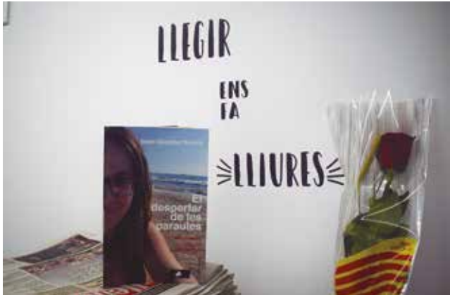
21 d'abril, presentació del llibre "El despertar de les paraules"