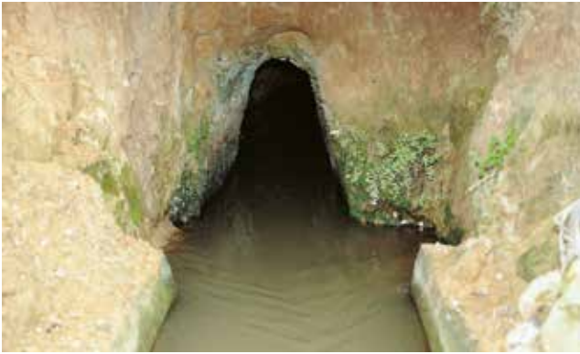
Sortida d'una mina. 1991