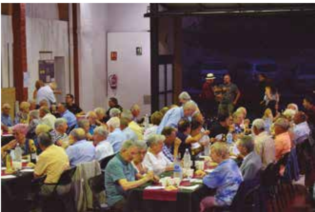
23 de juny, sopar de revetlla al local de Fires