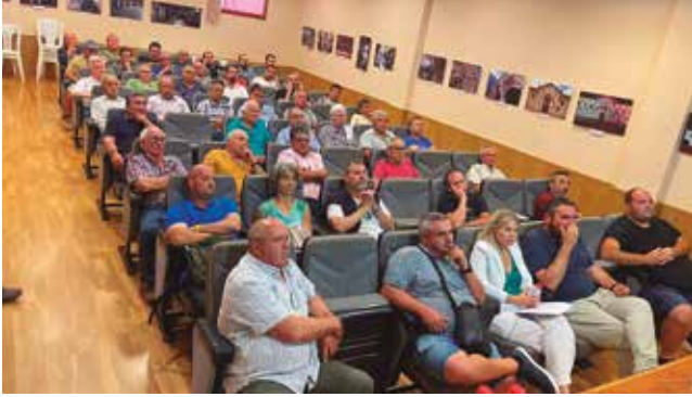
30 de juny, Assemblea General del Celler Cooperatiu de Vila-rodona

a Agrícola i Secció de Crèdit de Bràfim, SCCL ha tingut el 90,4% de vots favorables a la fusió amb la presència de 58 socis presents i representats. Ens els dos casos s'ha superat ampliament la majoria reforçada que requeria un acord d'aquesta importància.