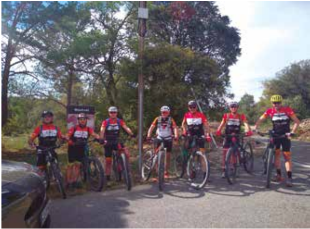
17 de juny, Prades