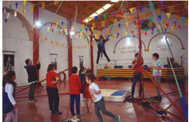
23 d'abril, espectacle familiar del Circ de les Musaranyes