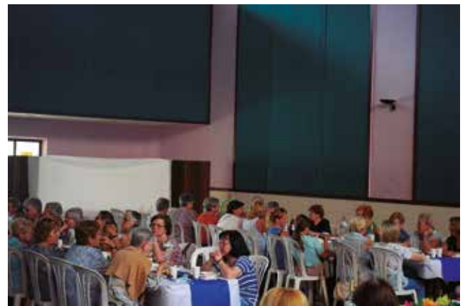
21 de juny, berenar de fi de curs

previst fer una sortida als Càtars de Bagà, amb un preu de 65 euros, encara hi ha places disponibles que podeu reservar a qualsevol membre de la junta. Us desitgem un bon estiu i Festa Major a tothom. Us esperem a totes el proper mes d'octubre a la presentació del