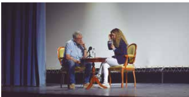
5 de maig, presentació de la candidatura "Compromís per Vila-rodona"