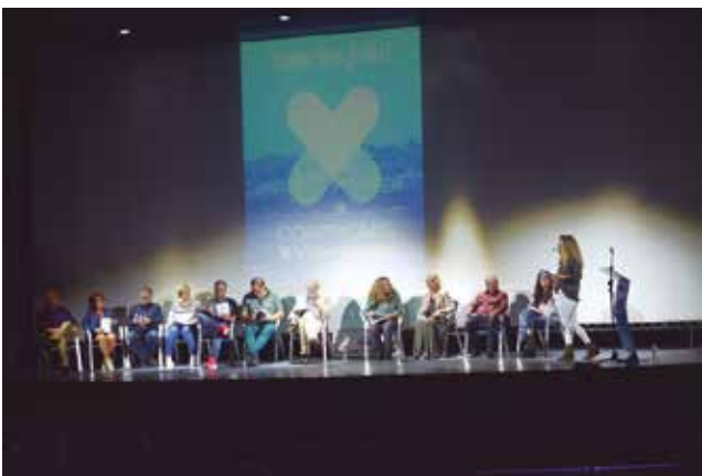
25 de maig, acte final de la candidatura "Compromís per Vila-rodonà" al Casal.