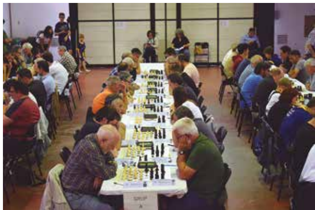
3 de juny, Torneig "Memorial Calbet"