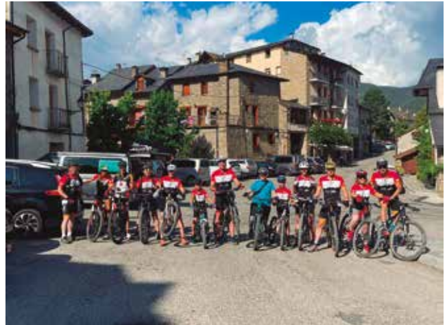
15 i 16 de juliol, sortida al Pirineu