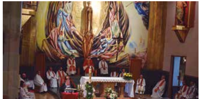
27 de maig, Vetlla de Pentecosta

Una de les apostes en les que estem treballant o que estem fent “lío” és la transmissió de la fe en els joves. Tots els joves des de 1r d'ESO fins a la Universitat es troben cada divendres del curs, al vespre, per compartir l'amistat, els interrogants i la fe. Les motivacions són diverses: els qui es preparen per a la confirmació, els qui ja l'han feta i volen créixer en la seva fe, els qui tenen preguntes, els qui s'ho passen bé, també per les amistats, les bones converses o la possibilitat de trobar un espai per xerrar de la vida