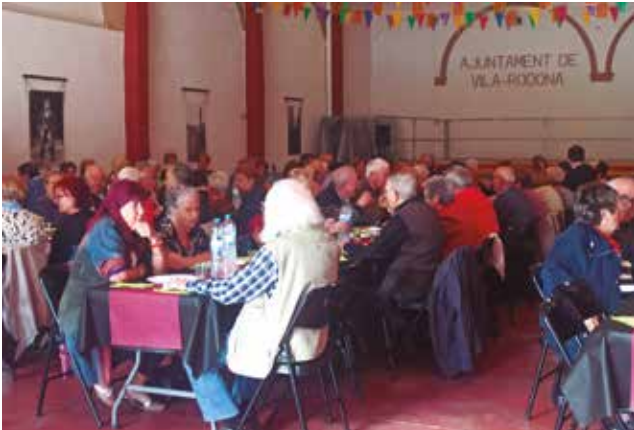
1 de maig, Festa de la Gent Gran, esmorzar