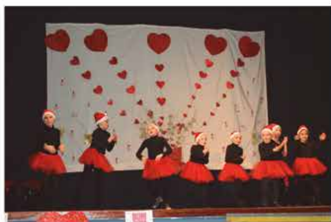
17 de desembre, espectacle per la Marató