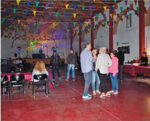
31 d'octubre, nit castanyera