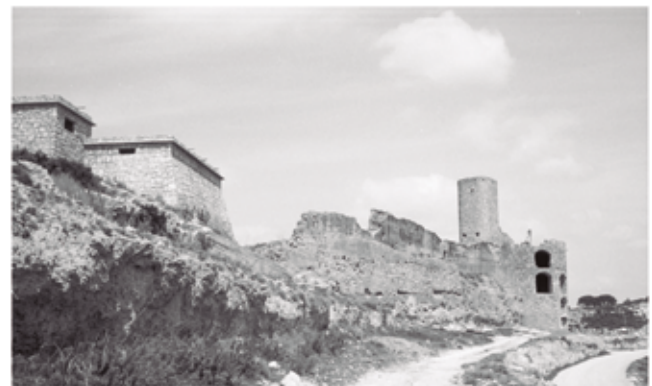
El castell en obres. Any 1971

el 1883; així com durant aquests anys posteriors a la guerra es desmuntaren algunes parts de muralla o se n'arranjaren d'altres a causa del seu mal estat.