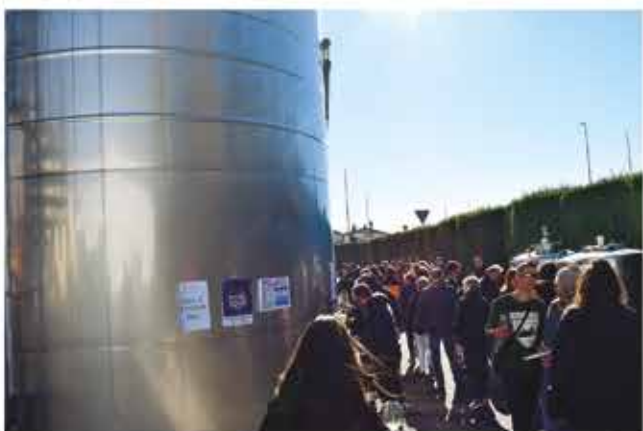
20 de novembre, XXVI Festa del Vi Jove