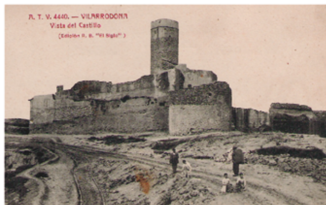
El castell a finals de la segona dècada del segle XX

Una postal dels anys 50 ens mostra tot l'espai de sota el castell abans de ser urbanitzat com a vial, de ser construïda la font, de ser enjardinat i d'haver-hi plantat els pins. Un espai erm, amb alguns corriols, un dels quals portava a cal Vidrier, la casa més elevada del poble, i d'altres devien ser "carralons" formats per les anades i vingudes de la canalla a peu o de cul a mena de tobogan. Sota mateix de les parets del castell es formava un petit replà on recordo que fins i tot durant un període, que no devia ser molt llarg, hi vàrem jugar a futbol. La Quintana del Castell era un indret amb una idiosincràsia i unes característiques diferenciades en bona part configurades per la mateixa orografia de l'espai, gairebé despenjat pel capdamunt de la trama urbana del poble. Recordem que