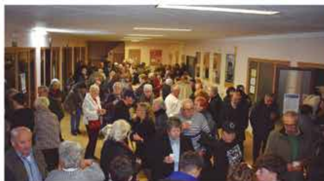
17 de desembre, espectacle per la Marató