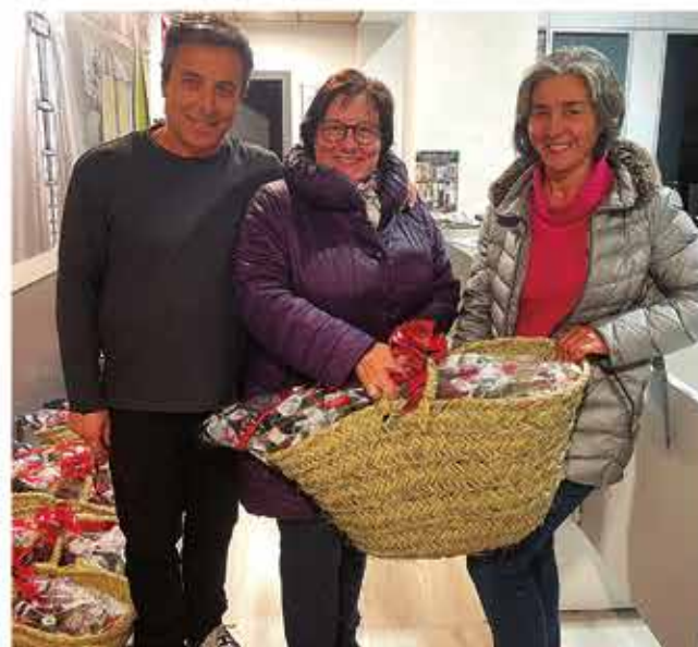
Entrega de les cistelles que es varen sortejar entre els impositors de la Secció de Crèdit

una copa de la sala del Centenari el video del Centenari i es va poder habilitar unes passarel·les per poder fer un mirador del celler. Davant del celler es va celebrar la 14 a trobada de "col·leccionistes de plaques de cava". Al final l'assistència fou de més de cent mil persones, superant en més de cent