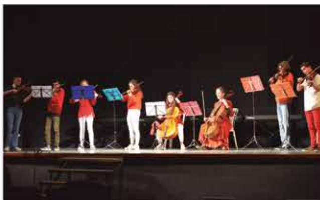
21 de desembre, concert de Nadal dels alumnes de l'escola de música Robert Gerhard de Valls.