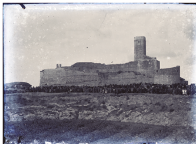
El castell el dia de la Fira. Finals del segle XIX.

L'aparença actual del castell correspon a les reformes que s'hi van fer a principis dels anys 70 quan la família que actualment ostenta la propietat va reclamar-la, segons els drets i la documentació que devien conservar. Devia ser cap a finals dels anys 60 que es va delimitar el perímetre de la propietat del castell, amb fites visibles en una fotografia de l'època. Segons havíem sentit explicar les pretensions dels propietaris eren molt més