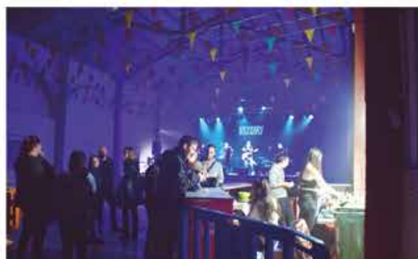
4 de novembre, nit jove amb el grup "Vizuri"