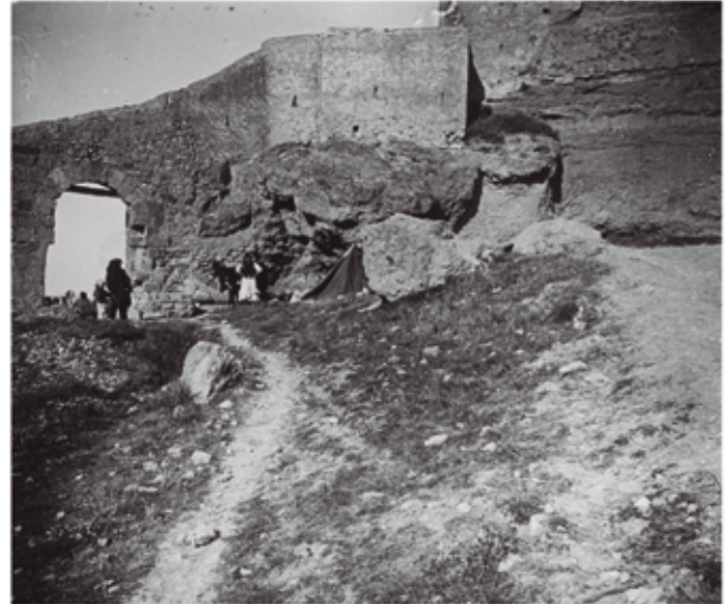
El portalet del castell. Probablement gitanos acampats. 1919