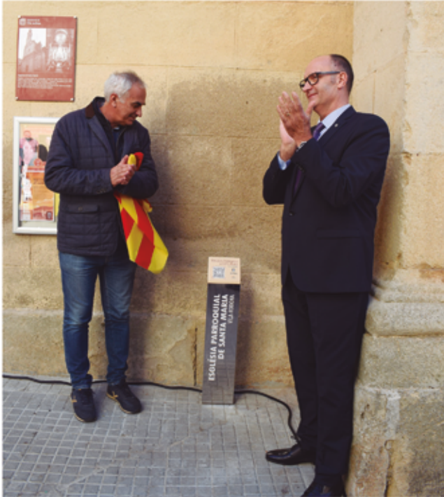
6 de novembre, inauguració punts d'informació turística