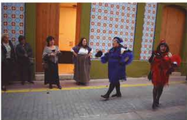
5 de novembre, el grup de teatre "Fira 1900" representà l'obra "Benvingut Cabaret"