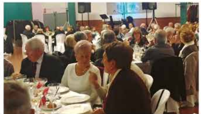
31 de desembre, cap d'any