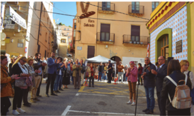
6 de novembre, inauguració punts d'informació turística

2021, la dissolució de l'agrupació dels municipis de Vila-rodonà i els Garidells, per al manteniment en comú d'un lloc de treball de secretaria i, en darrer lloc, es va aprovar la modificació de la plantilla municipal als efectes d'adequació de la plaça de secretari interventor.