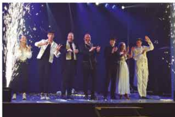
5 de novembre, nit de màgia