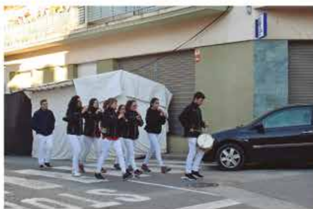
6 de novembre, matinades