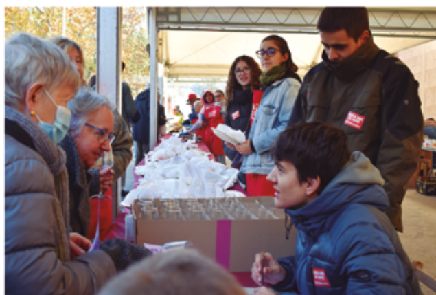
20 de novembre, XXVI Festa del Vi Jove