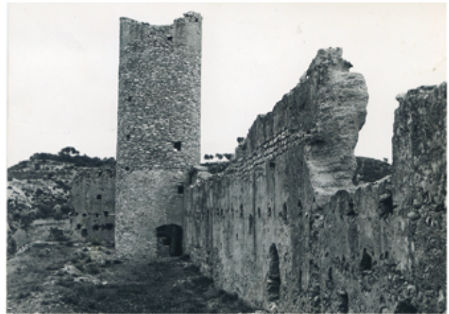
La torre del castell abans de les reformes