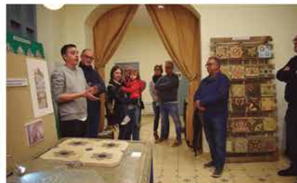
4 de novembre, inauguració exposició "Patrimoni en perill. La rajola catalana i el mosaic hidràulic"