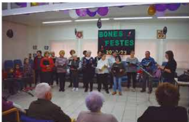
2 de gener, cantada de nades al Centre de Dia