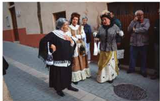
5 de novembre, el grup de teatre "Fira 1900" representà l'obra "Benvingut Cabaret"