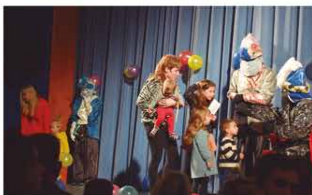
24 de desembre, arribada del Patge Reial i recollida de cartes