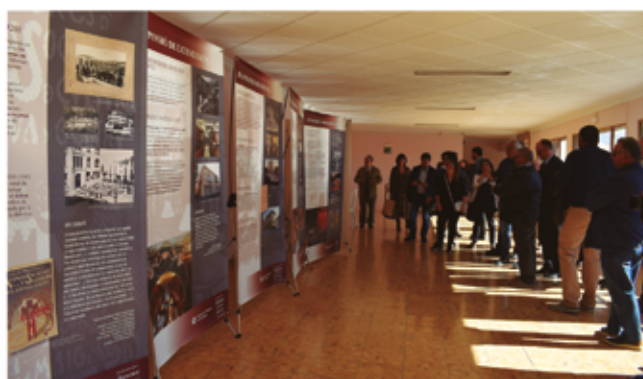
6 de novembre, exposició "Ateneus, cultura i llibertat"

són començar els campionats, el de "contru" va començar el 25 de novembre amb la participació de 13 parelles i el de parxis, organitzat pel