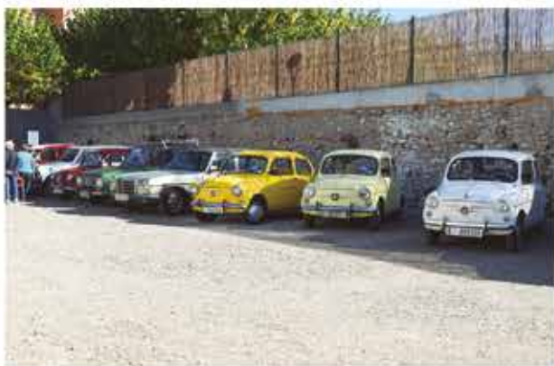
6 de novembre, trobada de cotxes clàssics