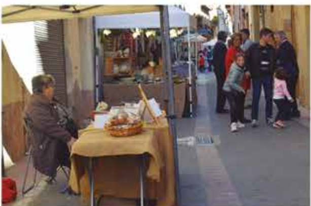
6 de novembre, parades al carrer Major