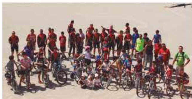
Activitat infantil del Club al Camp de futbol

Onze de novembre de 2011, quina coincidència de números oi ? (11/11/2011)