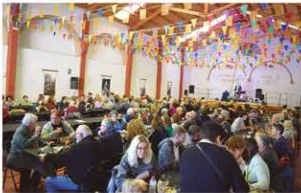
5 de novembre, concert-vermut