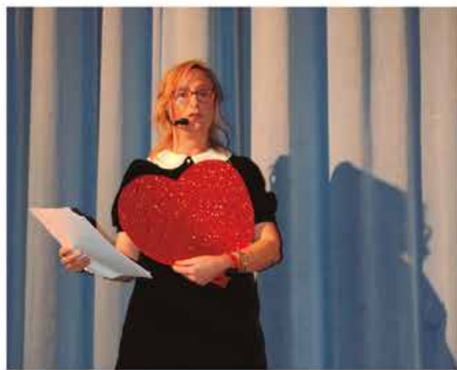
17 de desembre, espectacle per la Marató