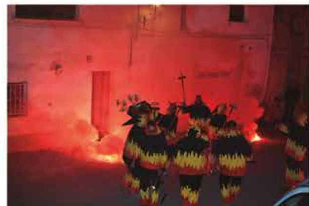
5 de novembre, correfoc dels Diables de Vila-rodona