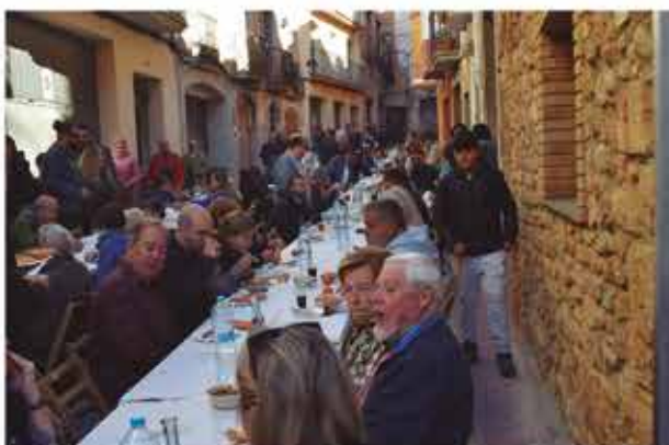
6 de novembre, fesolada popular i esmorzar de la fira