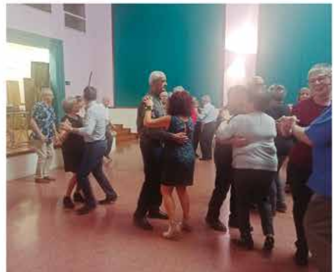
31 d'octubre, sopar i ball de la castanyada