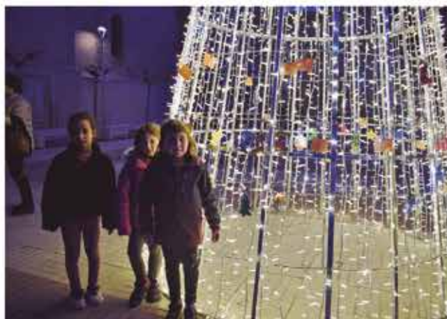
23 de desembre, xocolatada solidaria i penjada dels desitjos de Nadal al arbre