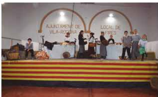
4 de novembre, representació infantil