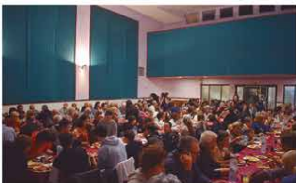
4 de novembre, sopar de Fira