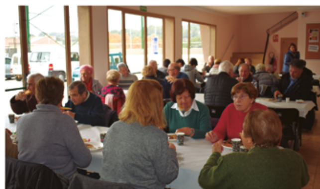
8 de desembre, esmorzar dia del soci