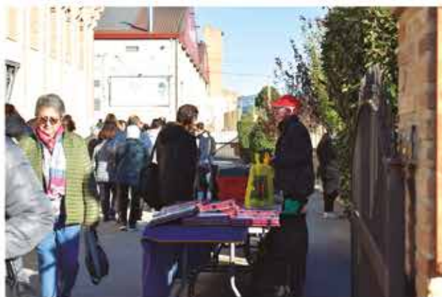
20 de novembre, trobada de col·leccionistes de plaques de cava