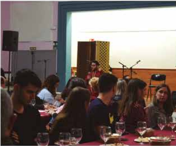
6 de novembre, Tastets: vins, tapes i música