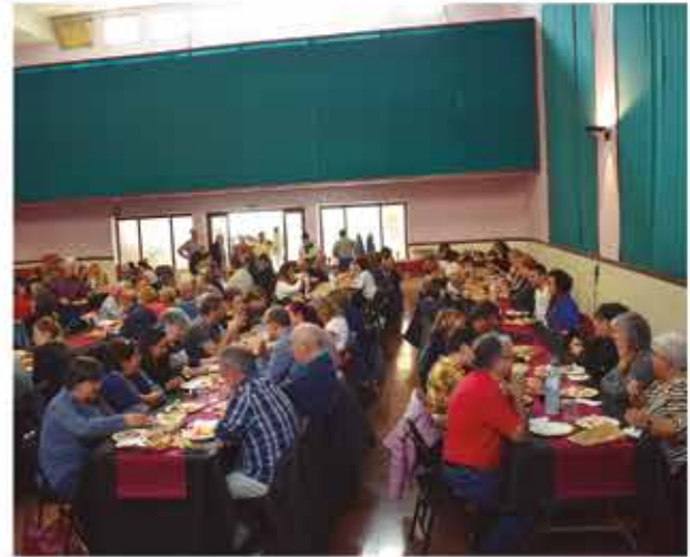
7 de novembre, fesolada