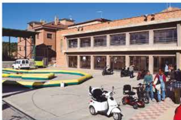
6 de novembre, circuit de vehicles elèctrics