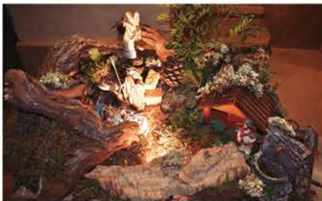
Concurs de Pessebres. Família Espelt-Guasch, 1r. premi Tradicional