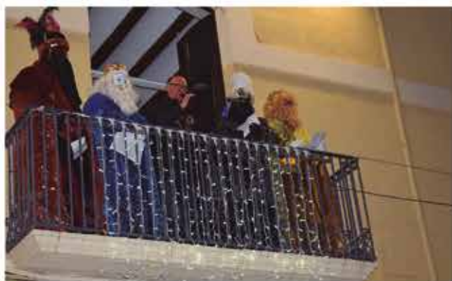
5 de gener, Els Reis d'Orient al balcó de la Casa de la Vila