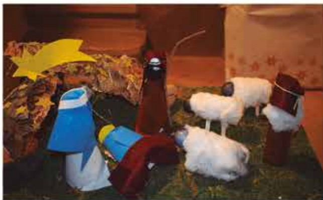
Concurs de Pessebres. Família Vilanova-Rañé, 4r. premi Creatiu