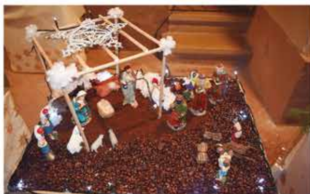
Concurs de Pessebres. Família Vives-Palau, 1r. premi Creatiu