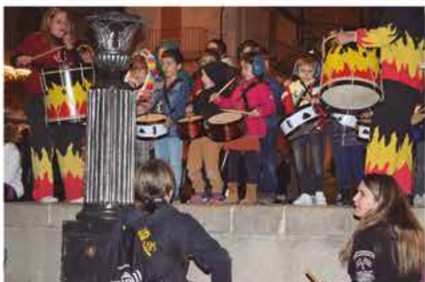
5 de novembre, correfoc dels Diablers de Vila-rodona