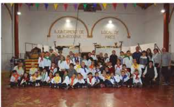
4 de novembre, representació infantil