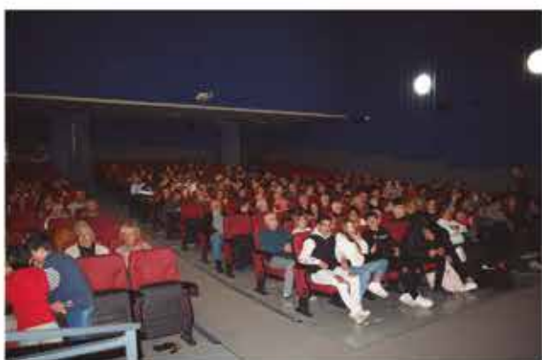
5 de novembre, nit de màgia