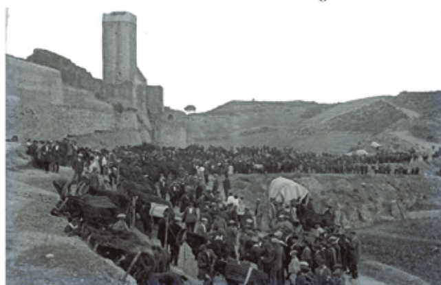
El firal darrera del castell. Any 1917.

ambiciosos. Reclamaven uns espais que ara són públics i que anaven fins a la part del carrer de la Quintana del Castell, davant de les cases que per sota hi donen de cara. Les cases que donen de cul al nord o al sud de la Quintana s'havien construït arrecerades a les parets de l'antiga muralla. A la part sud per sota del castell hi havia el "portalet del Castell", porta d'entrada al poble coneguda antigament com a portal de Barcelona, del que se'n conserva alguna fotografia. Durant la darrera guerra carlina va ser tapiada, com a mesura de fortificació. Va caure durant la postguerra.