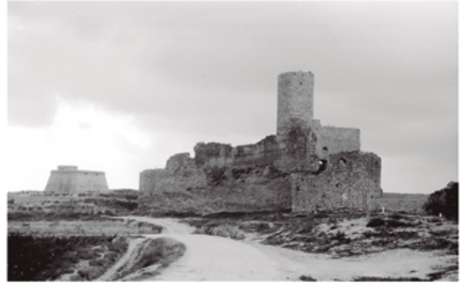
El castell. Any 1969

A Catalunya la guerra es donava per acabada a finals de 1875. Els dies 18, 19 i 20 de març de 1876 es van celebrar a Vila-rodonà les festes de la pau, tal i com es celebraren en moltes poblacions amb motiu d'haver finalitzat la guerra. La fi del conflicte va comportar l'enderroc d'elements de fortificació que molestaven als veïns. Per exemple l'obertura del portalet del castell el gener de 1876; les garites del costat de l'església i la del portal del Valenti, al carrer de les Hortes, l'any 1878; la garita del portal del Parera el 188; parets de fortificació que existien a les teulades de la rectoria i l'església