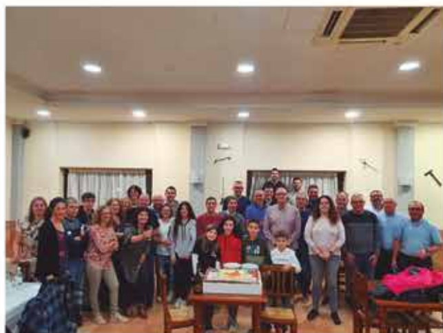
Sopar 10è Aniversari