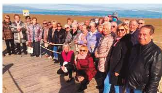
Sortida a Peníscola