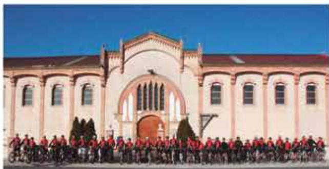
Març 2012 primera sortida amb el mallot oficial del club