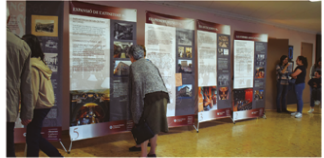
29 d'octubre, inauguració de l'exposició "Ateneus. Cultura i llibertat"

Les activitats del Centre d'Estudis del Gaià de la Fira ençà han estat la presentació del número 26 de La Resclosa i l'Encesa de torres, talaies i talaiots pels drets humans a la Mediterrània 2023.