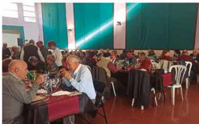
6 de desembre, Dia del soci de l'Associació de Jubilats