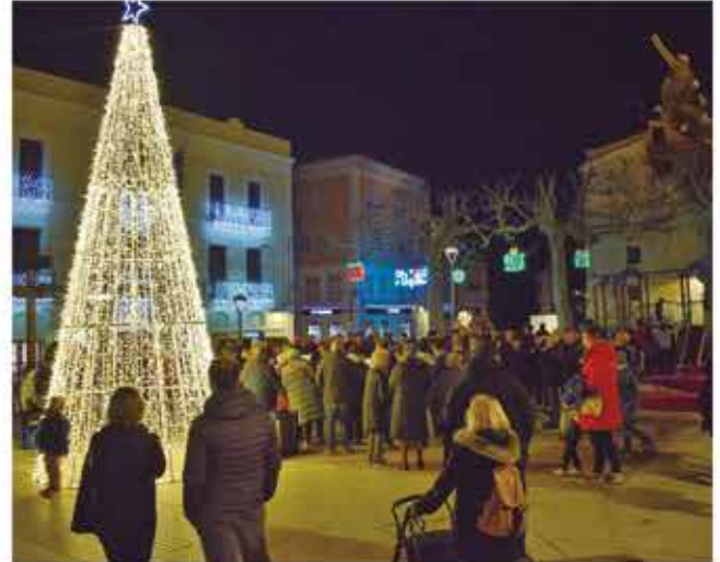
5 de desembre, encesa dels llums de nadal, cantada de nadales i repartiment de caldo

* Festival de Nadal de l'Escola Bernardí Tolrà amb l'espectacle "Per Tutatis!" amb recaptació de diners per la marató de TV3.