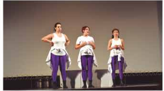
8 de desembre, teatre "Elles"