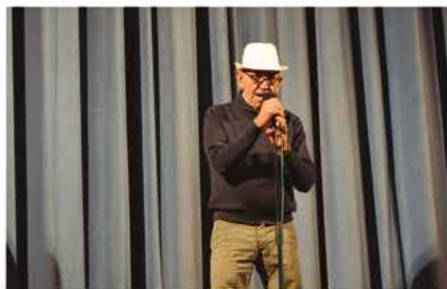
17 de desembre, espectacle per la Marató