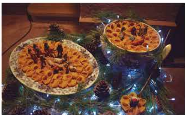
Concurs de Pessebres. Conxita Rabadà Vives, 2n. Premi Creatiu