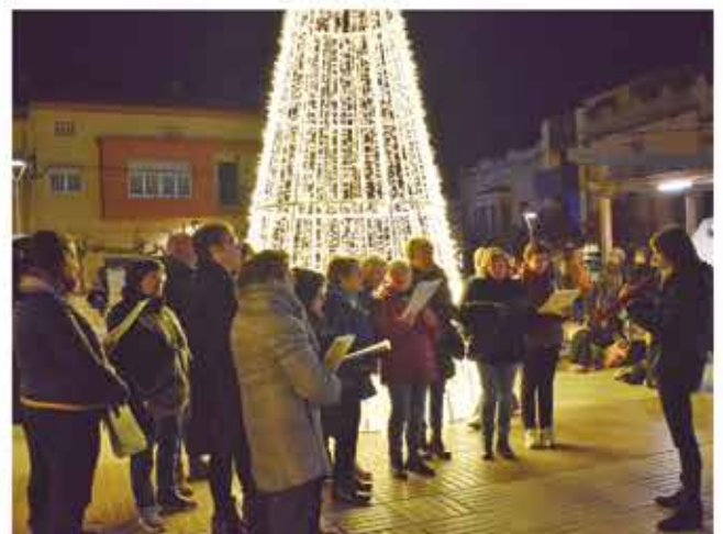
5 de desembre, encesa dels llums de nadal, cantada de nadales i repartiment de caldo