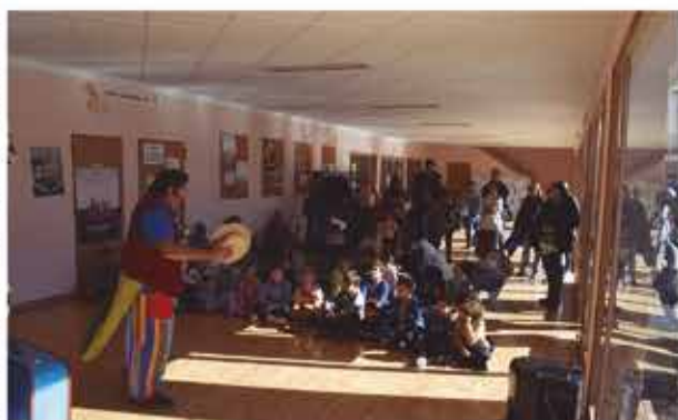
5 de novembre, matí infantil