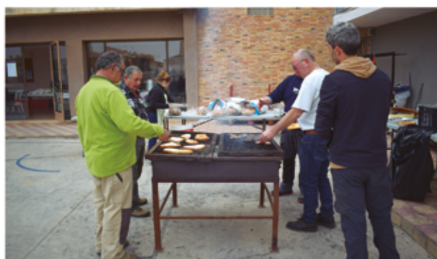
8 de desembre, esmorzar dia del soci