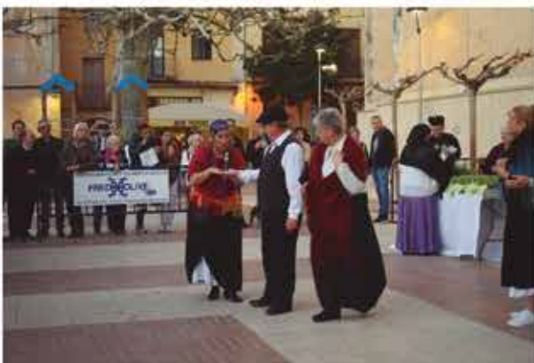
5 de novembre, el grup de teatre "Fira 1900" representà l'obra "Benvingut Cabaret"