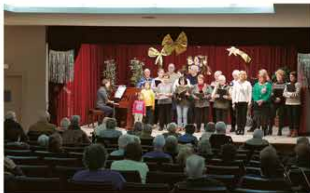
3 de gener, cantada de nades a la residència Santa Teresa