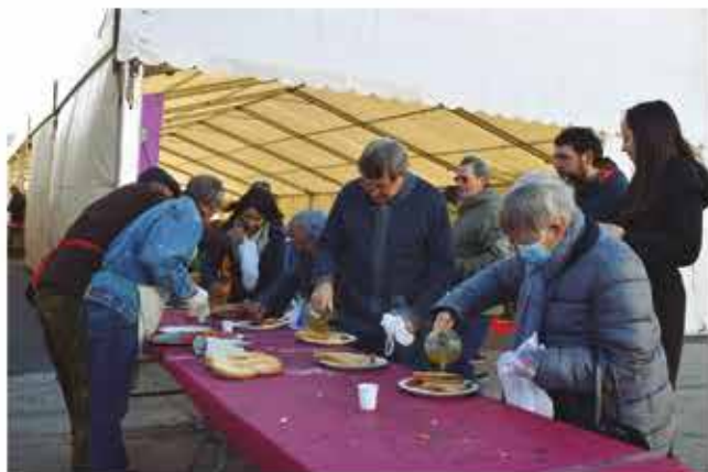
20 de novembre, XXVI Festa del Vi Jove