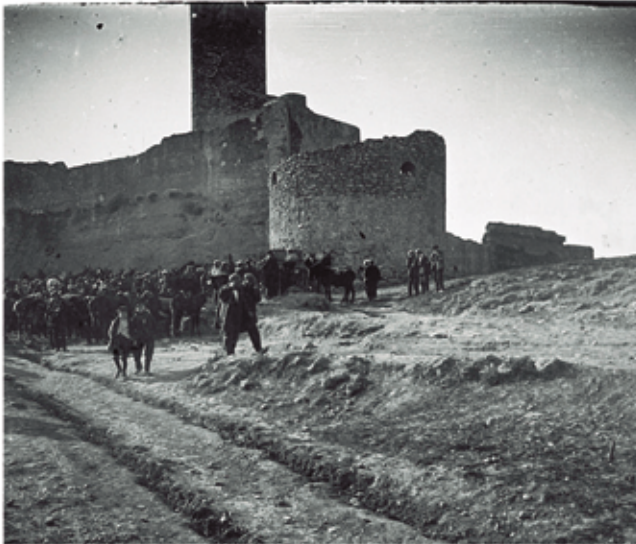
El castell el dia de la Fira de 1919.