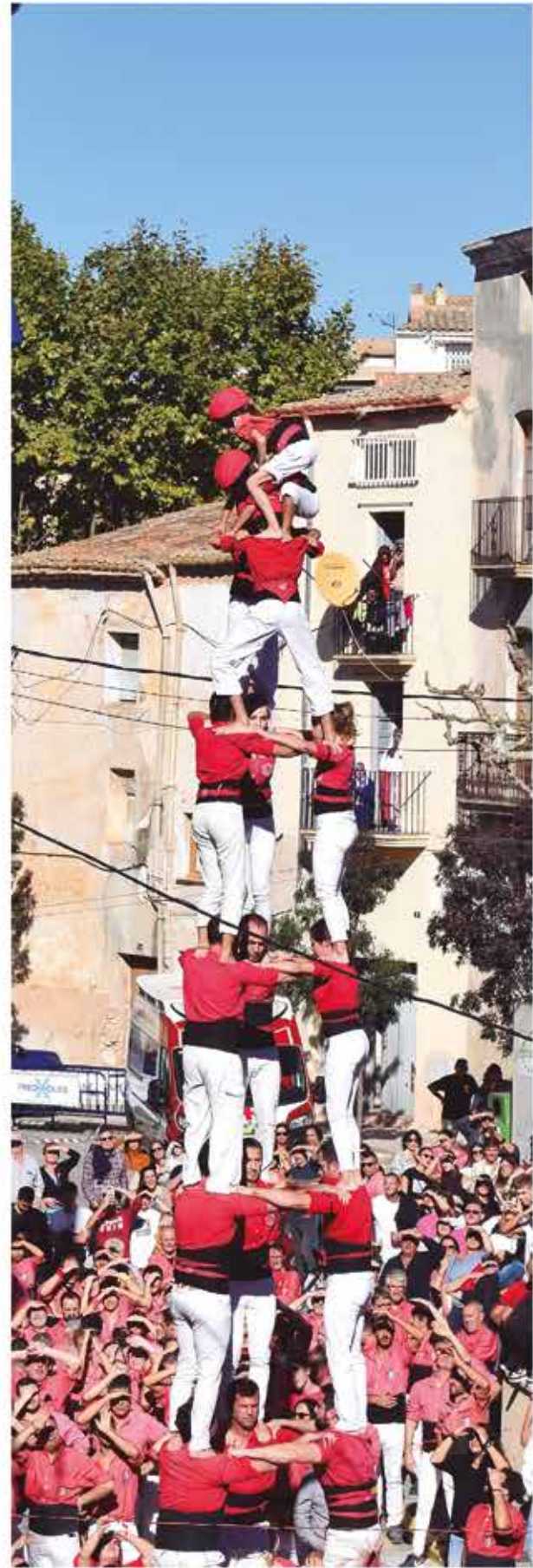
6 de novembre, diada castellera amb les colles vallenques