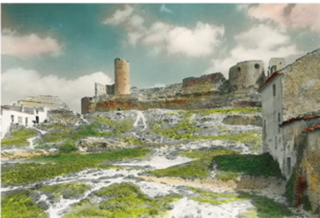
El castell des de la Quintana del Castell. Postal dels anys 50 del segle XX

fins l'any 1966 no va arribar l'aigua potable a les cases de la Quintana. Els seus habitants havien d'anar a la font de cal Robertó a omplir galledes i càntrics d'aigua. Si a tot el poble, a moltes cases es convivia amb els animals, ja fos la mula, les gallines, els pollastres, els conills o els porcs, la configuració de la Quintana del Castell permetia a més la seva presència al carrer o en corrals, i fins i tot hi corria algun porc.