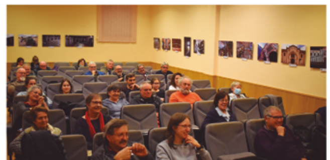
16 de desembre, presentació de "La Resclosa"