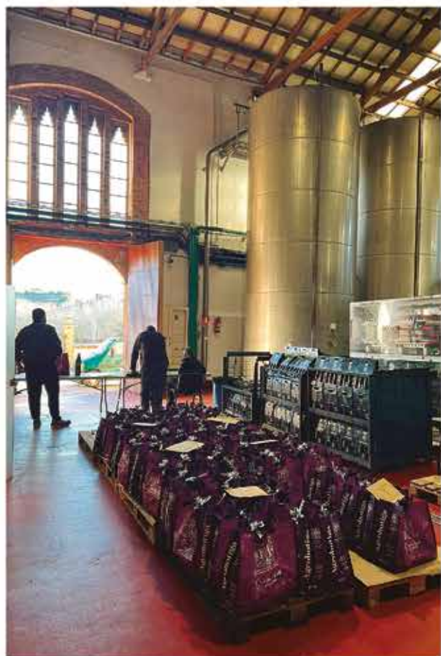
Obsequis de la promoció de l'agrobotiga i lots per als socis/es.